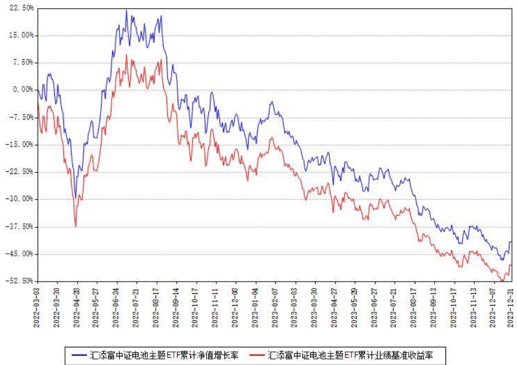
汇添富中证电池主题ETF累计净值增长率与同期业绩基准收益率对比图