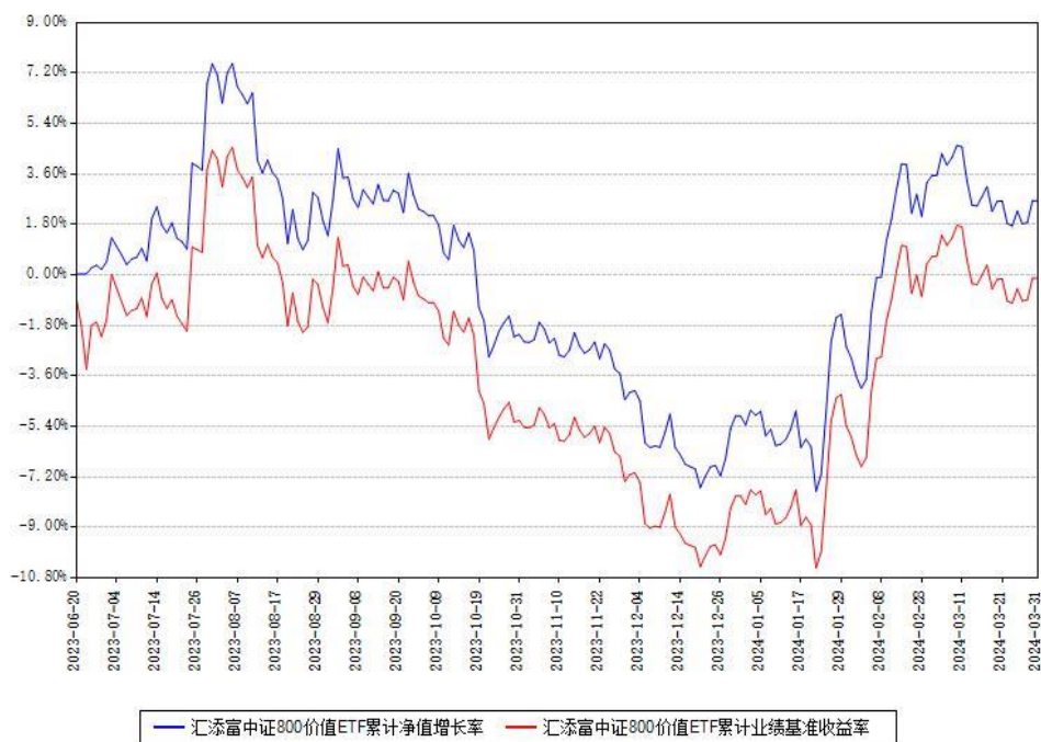
汇添富中证800价值ETF累计净值增长率与同期业绩基准收益率对比图

(二) 自基金合同生效以来基金累计净值增长率变动及其与同期业绩比较基准收益率变动的比较图