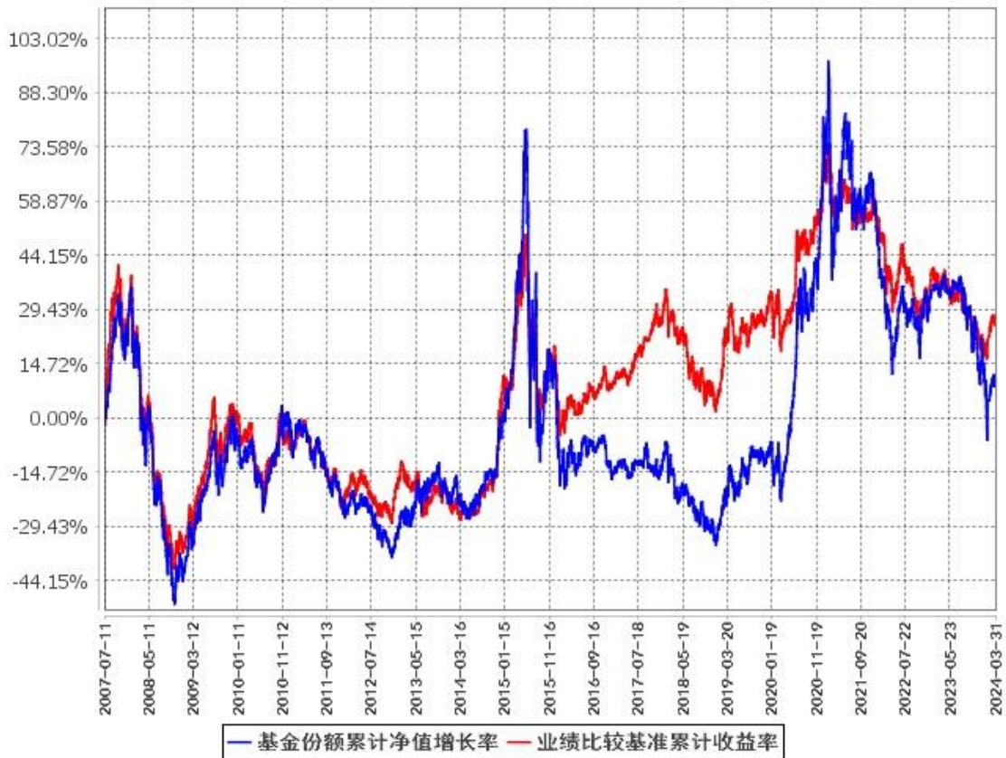
基金份额累计净值增长率与同期业绩比较基准收益率的历史走势对比图 (2007年7月11日至2024年3月31日)

注：1、按照本基金的基金合同约定，本基金自 2007 年 7 月 11 日合同生效之日起六个月内使基金的投资组合比例符合基金合同的约定。