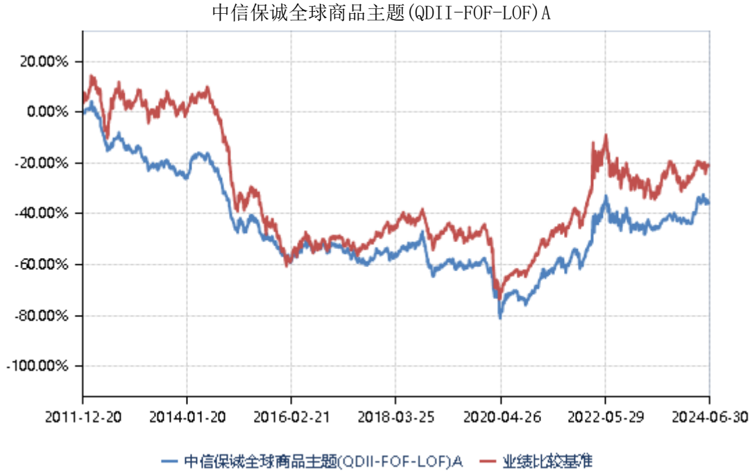
中信保诚全球商品主题(QDII-FOF-LOF) C