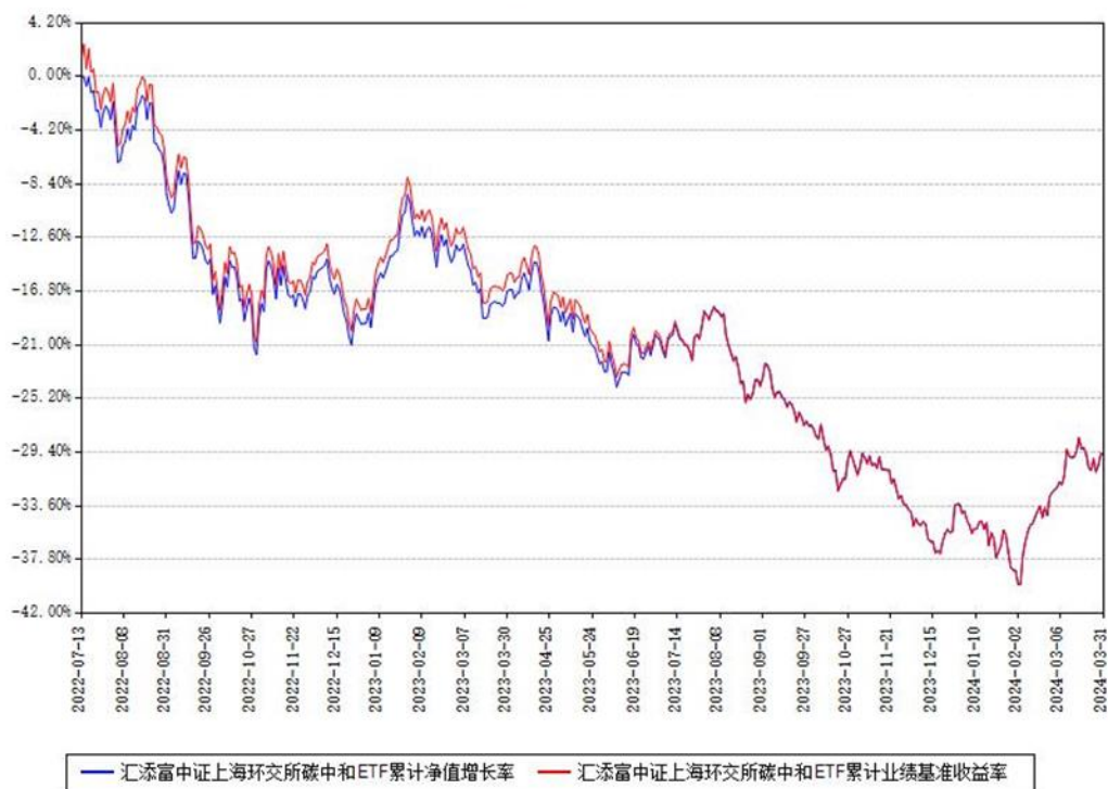
汇添富中证上海环交所碳中和ETF累计净值增长率与同期业绩基准收益率对比图

(二) 自基金合同生效以来基金累计净值增长率变动及其与同期业绩比较基准收益率变动的比较图