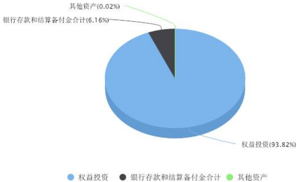
投资组合资产配置图表 数据截止日期:2024年03月31日