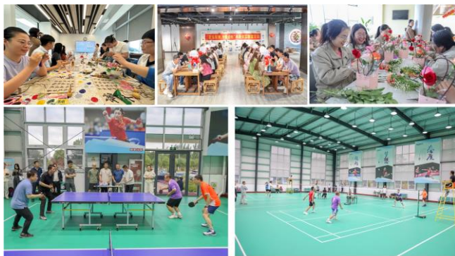
图：公司员工关怀活动

（三）在人文关怀方面，公司积极帮助困难员工，高度重视员工身心健康。报告期内，公司工会向困难员工提供救助金；开展员工读书分享会、心理健康辅导专题讲座、羽毛球比赛、乒乓球比赛、三八妇女节主题活动、优秀员工家属开放日活动、单身员工联谊活动、员工生日会、工地慰问送清凉等形式多样的员工活动，提升员工的幸福感和获得感。