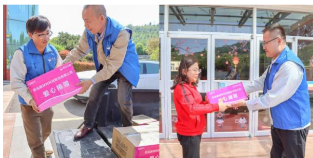
图：“泓基金”志愿者向枣庄市儿童福利院送去爱心物资

（二）在弱势帮扶方面，公司长期对枣庄市儿童福利院进行爱心慰问。报告期内，公司内部公益平台“泓基金”组织志愿者两次前往枣庄市儿童福利院，捐赠爱心物资，为福利院儿童送去温暖。