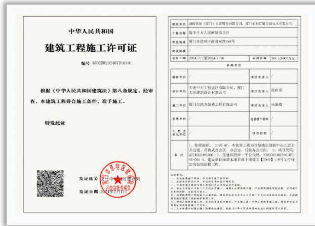
图二：9楼建筑工程施工许可证