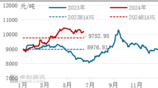
图 1 2023 年与 2024 年华东普通透苯走势对比图

从 PS 行业看，2024 年上半年，国内 PS 市场整体呈现震荡上行的运行态势。在供给端，成本驱动带动 PS 价格持续上行，其中原料苯乙烯及其上游纯苯的强劲上行，成本逐级向下传导；与此同时，虽然报告期内国内 PS 新产能继续释放，产能体量进一步扩大，但实际产量供应增量有限。叠加供应阶段性、结构性偏紧以及需求复苏助力，PS 市场价格稳步攀升。