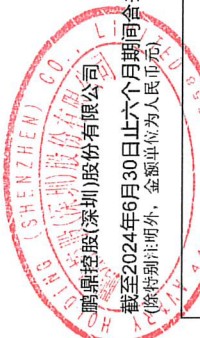
鹏鼎控股(深圳)股份有限公司 截至2024年6月30日止六个月期间合并股东权益变动表 (除特别注明外,金额单位为人民币元)