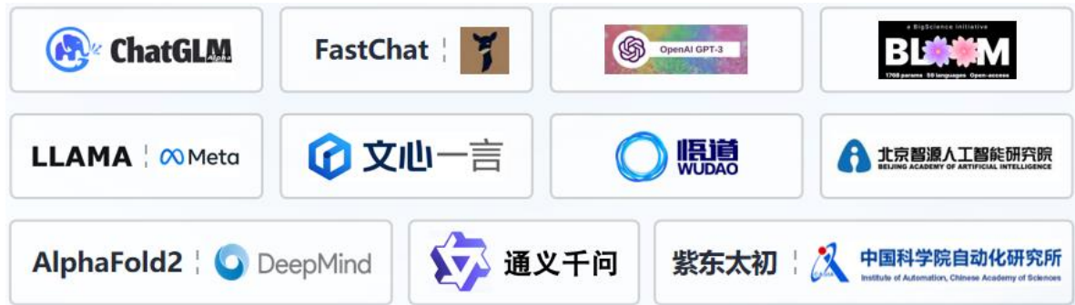
海光产品在大模型的适配与实践

海光 DCU 提供自主开放的完整软件栈，包括“DTK（DCU Toolkit）”、开发工具链、模型仓库等，支持 TensorFlow、Pytorch 和 PaddlePaddle 等主流深度学习框架与主流应用软件。依托完善的开放式生态，公司构建了拥有完善层次化软件栈的统一底层硬件驱动平台，其能够适配不同 API 接口和编译器，并支持常见的函数库、AI 算法与框架等。在 AIGC 持续快速发展的时代背景下，海光 DCU 能够支持全精度模型训练，实现了 LLaMa、GPT、Bloom、ChatGLM、悟道、紫东太初等为代表的大模型的全面应用，与国内包括文心一言、通义千问等大模型全面适配，达到国内领先水平。