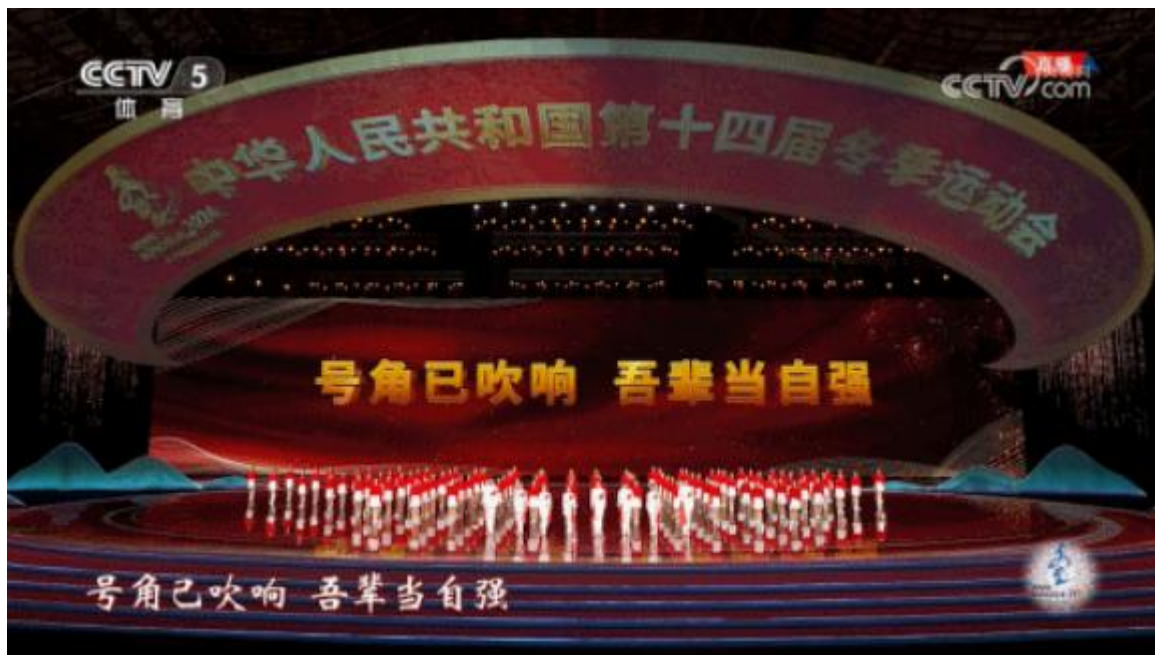
第十四届全国冬季运动会开幕式