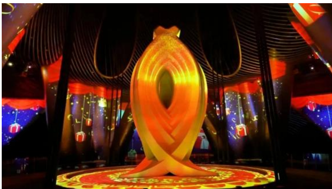
上海上海天时 632 艺术空间

C 端业务的开拓不仅会减轻应收账款的压力，整体业务稳定性业也会得到提高。公司在稳定政府客户（ToG）和企业客户（ToB）以外，C 端运营类项目后续会成为公司业务发展重点。多年来公司在灯光、音响特效、效果展示等方面积累丰富经验，为其在 C 端市场的拓展提供了重要的优势。而 C 端客户也是对公司政府客户（ToG）和企业客户的（ToB）补充。