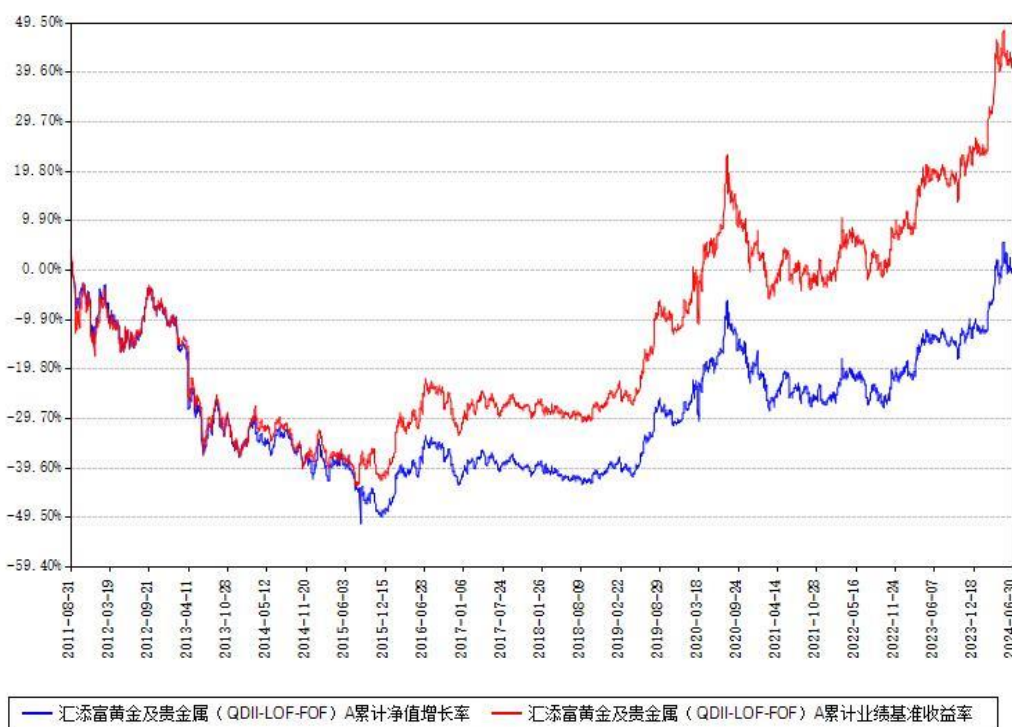
汇添富黄金及贵金属（QDII-LOF-FOF）A累计净值增长率与同期业绩基准收益率对比图

2、自基金合同生效以来基金累计净值增长率变动及其与同期业绩比较基准收益率变动的比较图