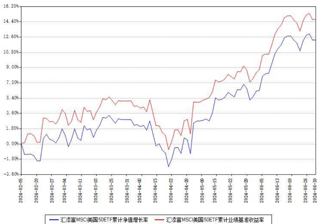
汇添富MSCI美国50ETF累计净值增长率与同期业绩基准收益率对比图