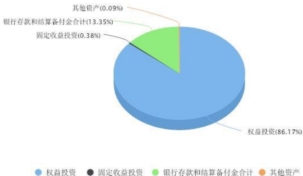
投资组合资产配置图表 数据截止日期:2024年06月30日