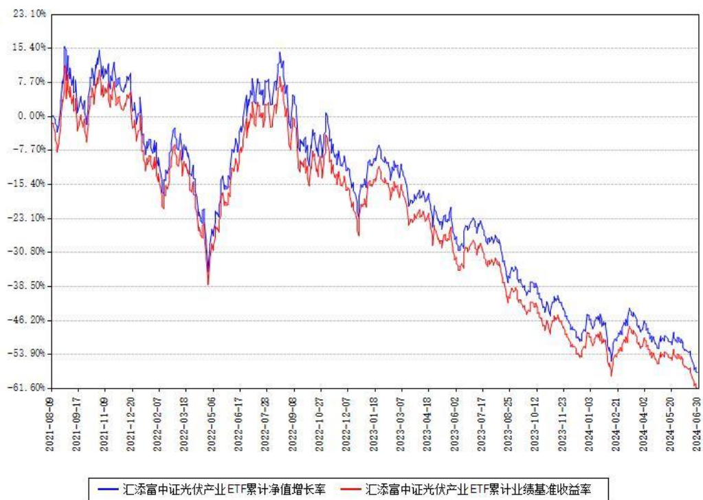
汇添富中证光伏产业ETF累计净值增长率与同期业绩基准收益率对比图