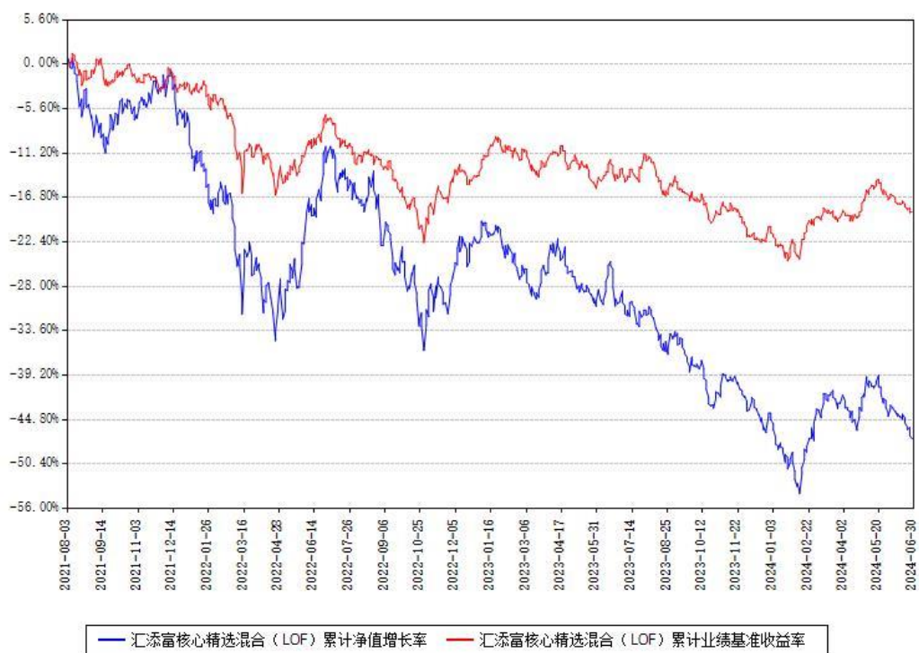
汇添富核心精选混合（LOF）累计净值增长率与同期业绩基准收益率对比图