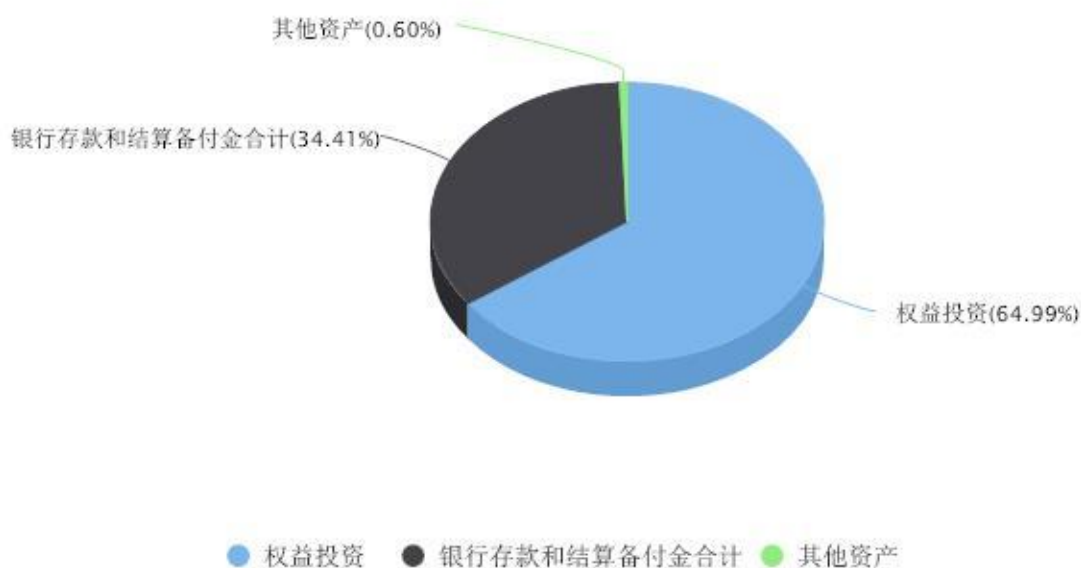
投资组合资产配置图表 数据截止日期:2024年06月30日