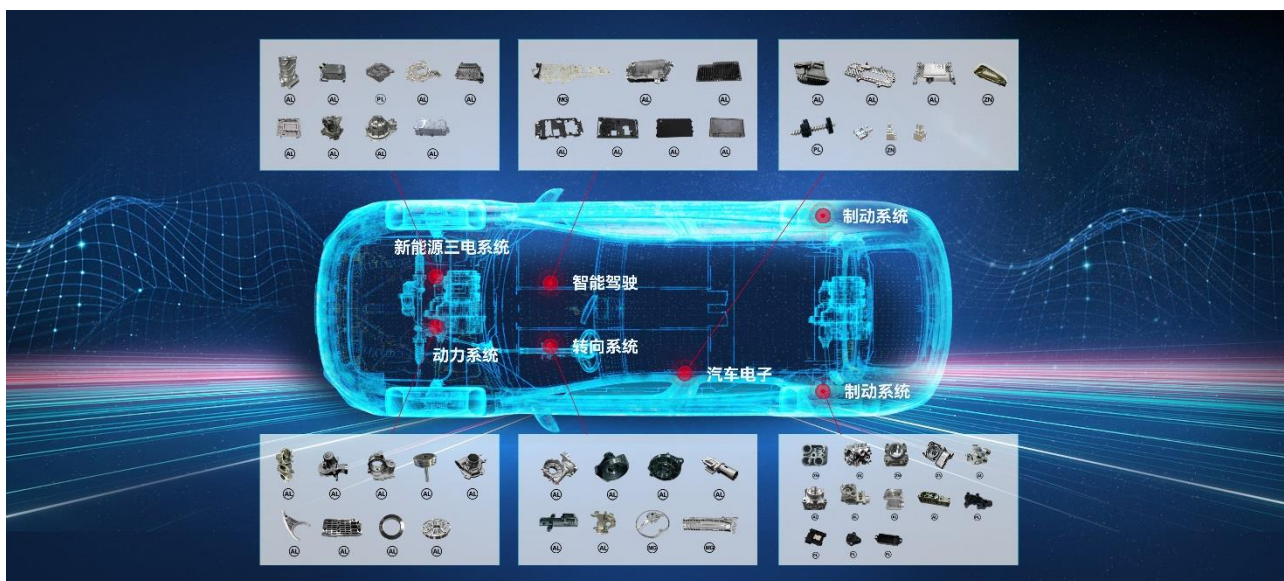
公司精密压铸产品在汽车的应用领域示意图