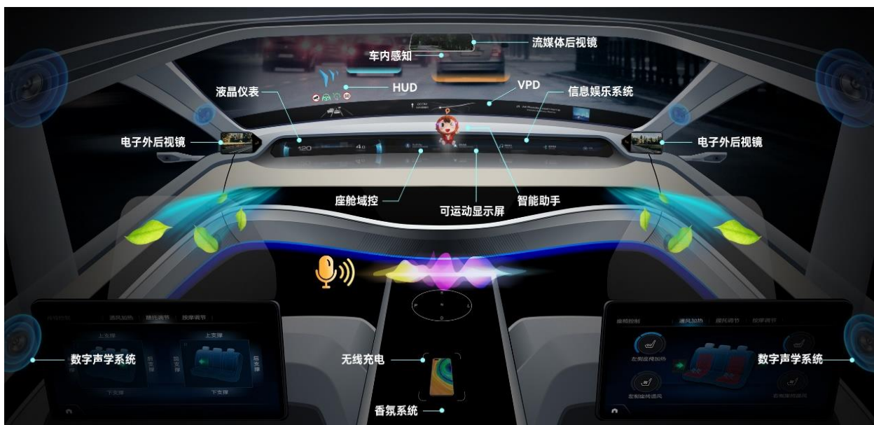
公司汽车电子业务智能座舱产品应用场景示意图

在智能座舱领域，公司坚持以用户体验和使用价值为导向，集成软硬件系统和丰富的生态资源，并运用多种创新的人机交互技术，围绕智慧出行、万物互联的应用场景，向客户提供先进的智能座舱解决方案，为用户提供沉浸式的智能座舱体验。