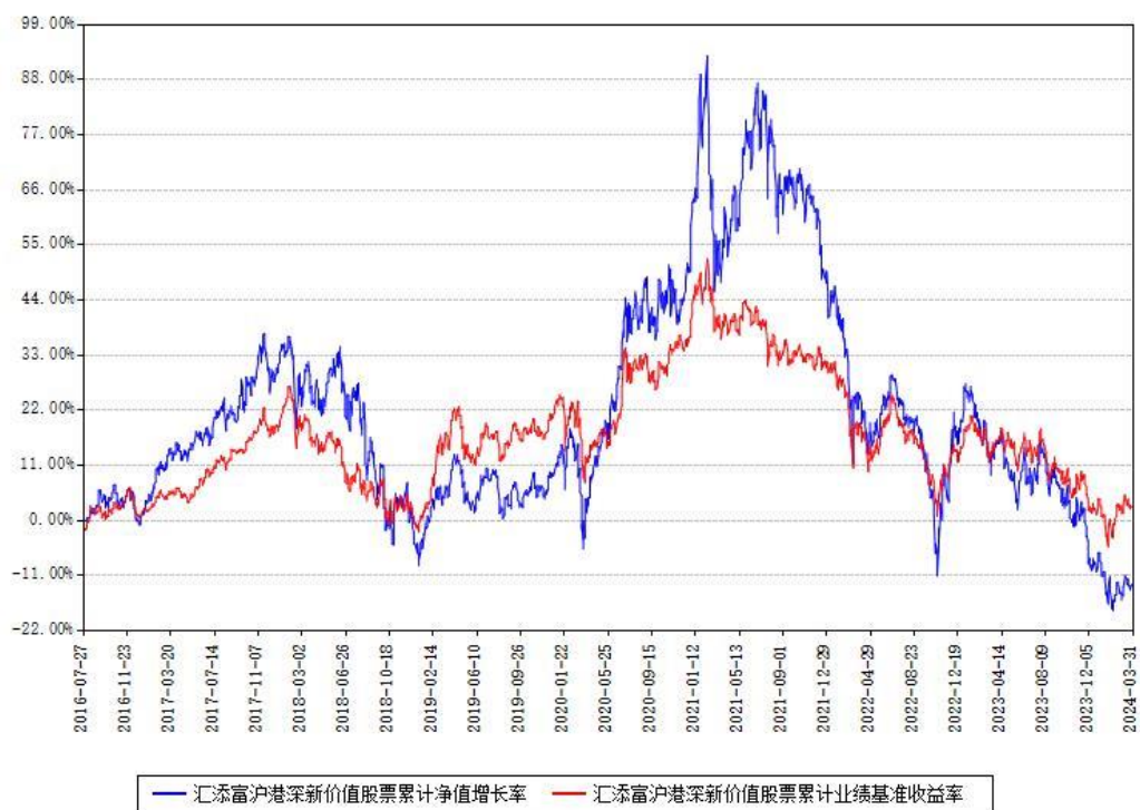
汇添富沪港深新价值股票累计净值增长率与同期业绩基准收益率对比图