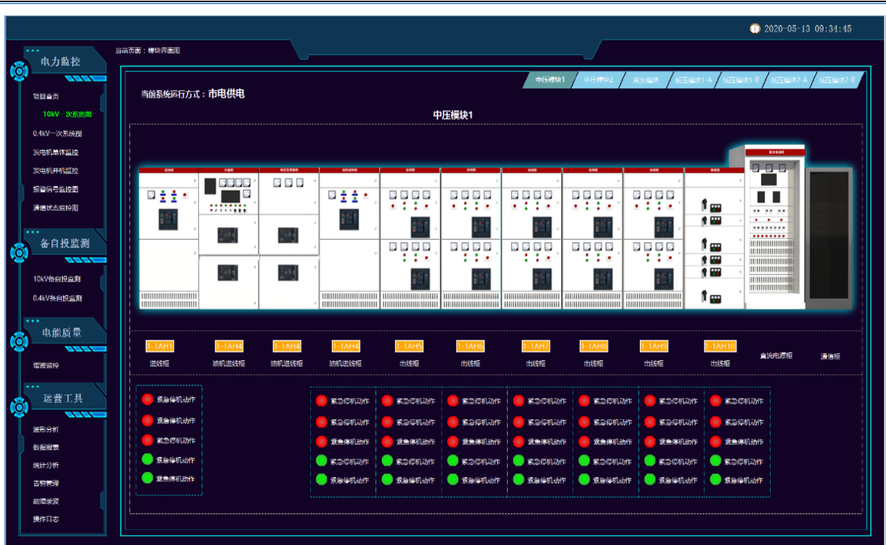
图例：系统管理界面