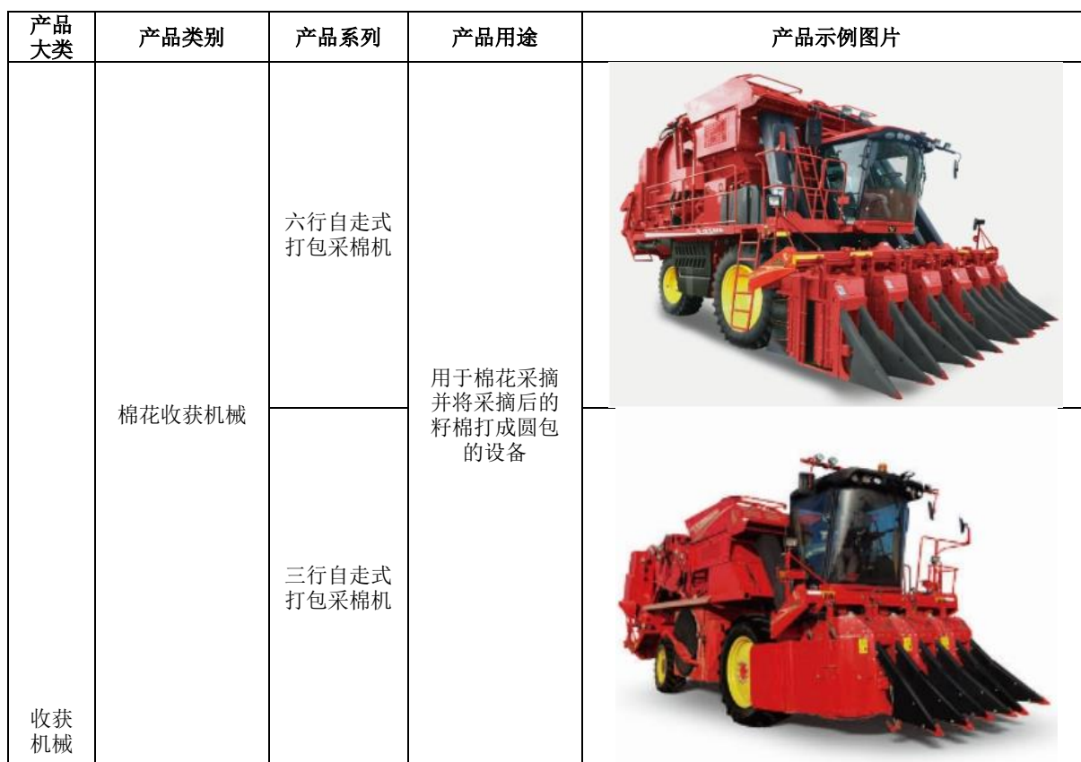
表 2：公司收获机械主要产品及用途

公司在立足棉花加工机械传统业务基础上，积极布局收获机械产品。公司收获机械按照采摘作物不同主要分为棉花收获机和粮食收获机两大类，其中棉花收获机根据功能的不同，主要包括六行自走式打包采棉机、三行自走式打包采棉机、三行/四行自走式箱式采棉机；粮食收获机主要包括谷物联合收获机和玉米籽粒联合收获机。报告期，公司加大研发创新力度，不断丰富产品结构，研发了果类收获机械自走式番茄收获机，目前处于小批量验证推广阶段。主要产品及用途详见下表：