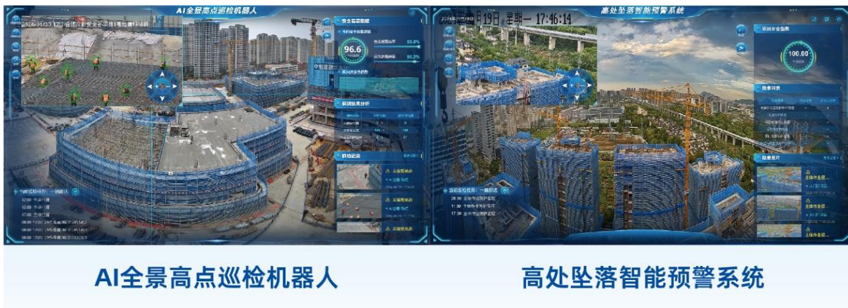
AI全景高点巡检机器人

在 AI 技术机器视觉领域，公司继续对 AI 全景高点巡检机器人进行迭代优化，对项目现场全天候监测，有效识别高处坠落等安全隐患并实时预警，实现快响应和有效管理；对智能视频监控系统进行升级，通过优化改进无感考勤的跟踪算法、陌生人入库算法和梯度识别算法等，提升无感考勤落地应用效果；此外，为压缩智能视频监控系统的硬件成本，公司优化了基于国产芯片的算法适配和性能，对常规服务器算法进行移植，并对后端调度进行编解码优化、性能存储优化，提升系统性能的同时实现降本。