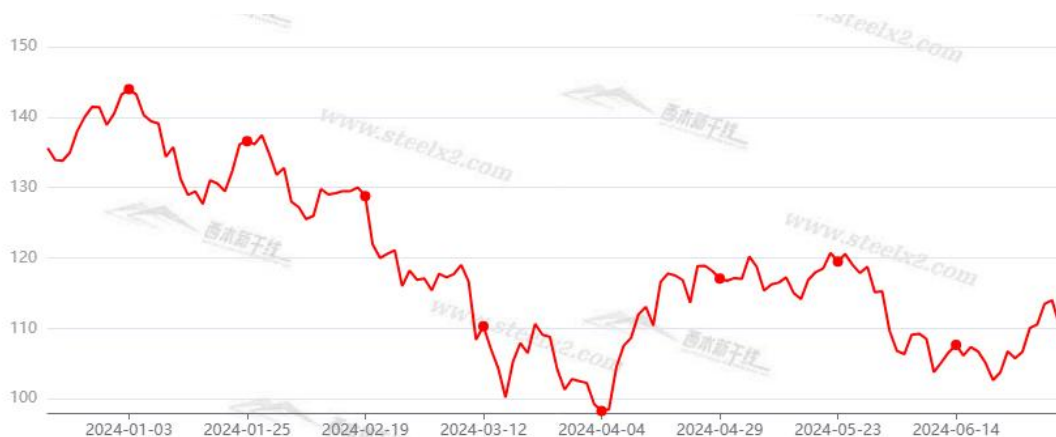
数据来源：西本资讯