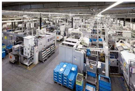
高精密零部件板块“黑灯工厂”一角