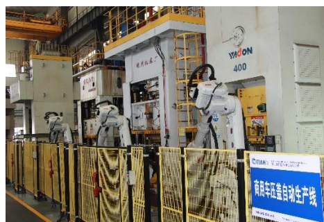
湖北三环自动化车间一角