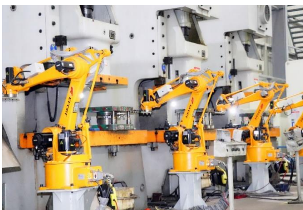
公司数字化车间一角