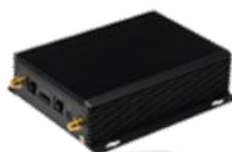
深目系列边缘计算盒子