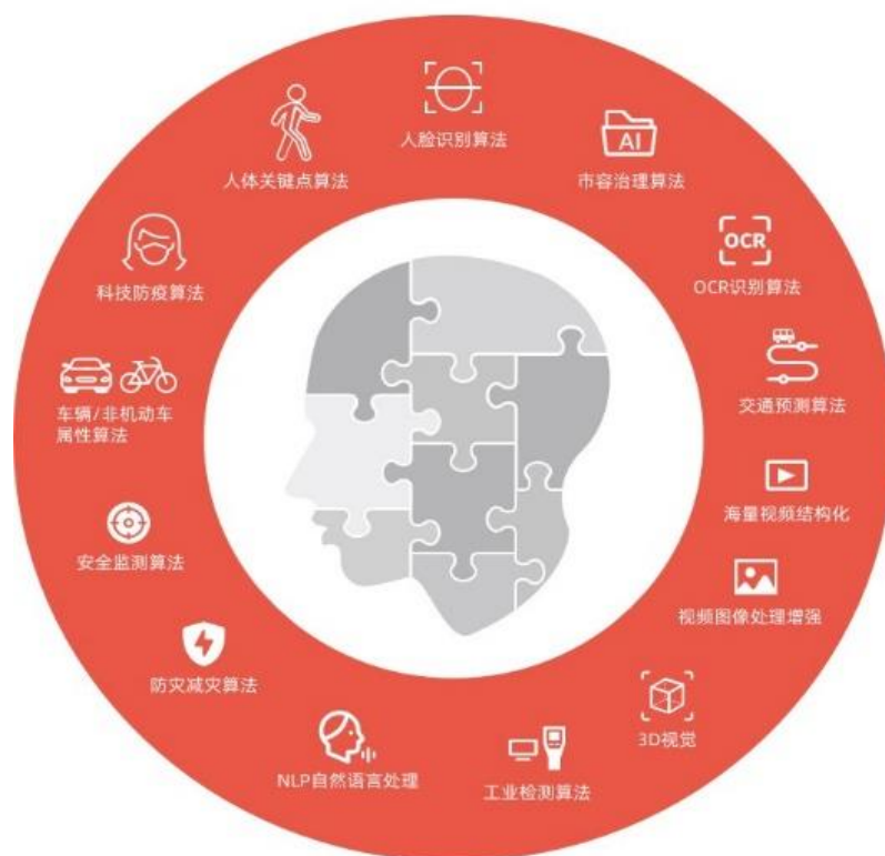
算法芯片化基础技术