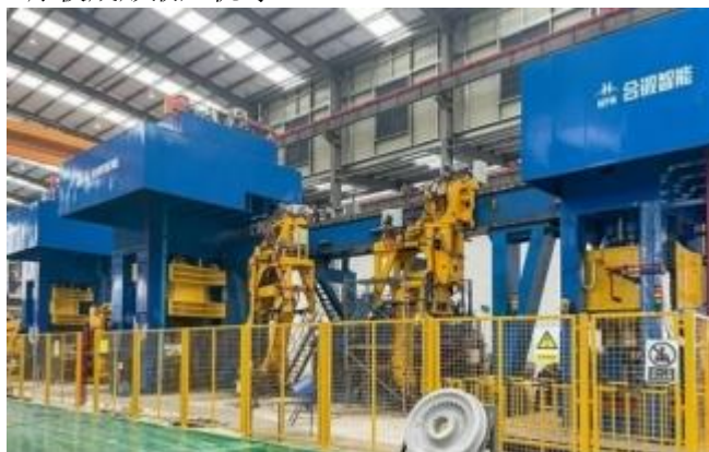
车轮锻造液压机生产线

⑤轨道交通领域：主要为高铁道岔AT根部锻造生产提供全自动生产线、钢轨压弯及校直液压机、车轮锻造液压机、厚板成形液压机等。