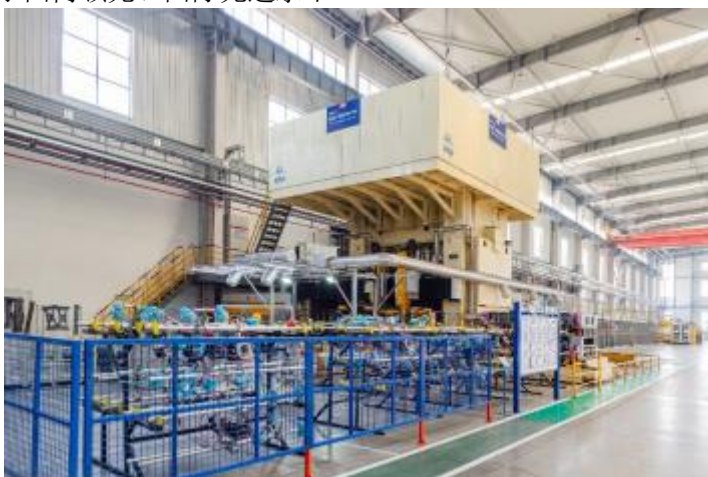
超高强钢直接热冲压成形生产线

超高强钢热冲压成形液压机及生产线：主要用于汽车轻量化领域，是目前汽车轻量化使用最为广泛的技术之一，其生产的零件强度达到1500MPa。目前公司生产直接热成形和间接热成形液压机及生产线，处于国内领先、国际先进水平。