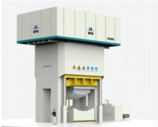
重型厚板成形液压机

④船舶领域：产品主要为数控多轴板件成形压机、厚板成形液压机、大型单柱液压机、封头液压机，主要用于船板压制成形，可实现对板材、型材及构件的弯曲成形等多种工艺操作。