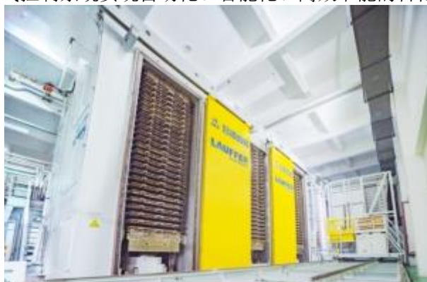
双幅CCL真空层压机生产线

⑦电子领域：公司定制开发了层压机生产线，主要用于PCB、CCL生产工艺，当前国内使用的压机主要由德国和日本等企业提供，此前国内尚无此类设备的研发和生产能力。我公司在国内首次研发了层压机成套设备，其主要由热压机、冷压机、装载机、卸载机、移栽车、加热系统、抽真空系统组成，通过电气控制系统实现自动化、智能化、高效节能的目标。