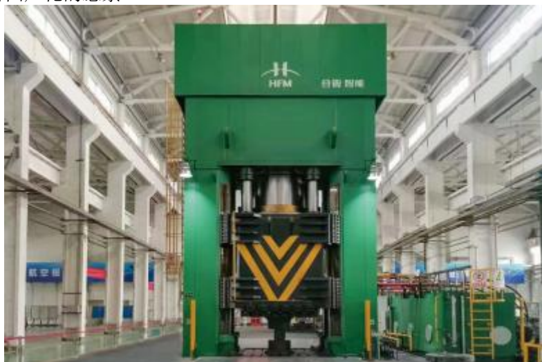
精密等温锻造液压机

②航空航天、国防军工领域：产品主要为模锻压机、等温锻造液压机、自由锻造液压机、快锻液压机、双动充液拉深液压机、多向模锻液压机、精密双向压药液压机、核燃料多压头预压体成型设备等，主要用于飞机和航天器的核心零部件如飞机发动机叶片、制动片、起落架等以及航天整流器、燃料舱、高压异形接头以及高温气冷堆核电站系统工程中球形核燃料元件的生产。破解了航空航天、国防军工领域的部分“卡脖子”难题，打破了部分关键核心部件受制于人的局面，实现了核心设备国产化的愿景。