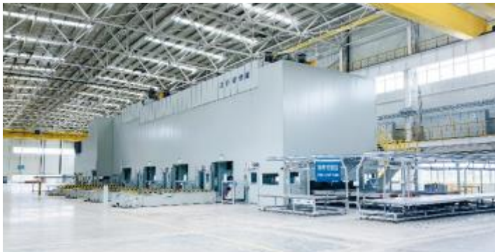
大型液压机冲压生产线

大型液压机冲压生产线：主要用于汽车覆盖件的冲压生产工艺，一般由5-6台液压机、拆垛清洗涂油系统、机器人上下料系统等组成。目前一般采用伺服高速液压机，实现节能降噪。