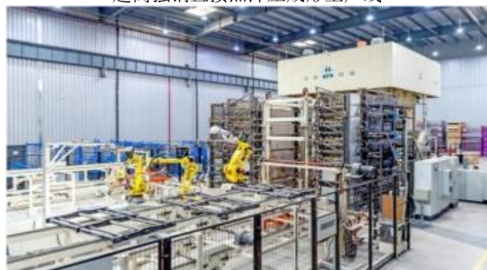
超高强钢间接热冲压成形生产线

复合材料液压机及生产线：复合材料是由两种或两种以上的组分材料（如树脂、纤维）按一定方式复合而成，具有柔性好、强度高优势，在汽车上主要用于汽车轻量化。公司的复合材料液压机主要有LFT-D、H-RTM、C-RTM、SMC、湿法模压等工艺成形装备。公司的复合材料液压机主要有LFT-D、H-RTM、C-RTM、SMC、湿法模压等工艺成形装备。公司借助伺服电机驱动、蓄能器储能、伺服液压控制等技术，产品具有节能、适用范围广、效率高等优点。