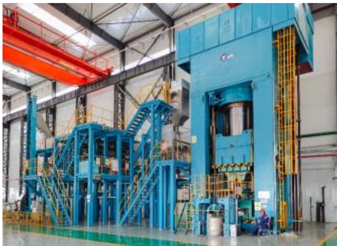
钛电极成形生产线

⑦电子领域：公司定制开发了层压机生产线，主要用于PCB、CCL生产工艺，当前国内使用的压机主要由德国和日本等企业提供，此前国内尚无此类设备的研发和生产能力。我公司在国内首次研发了层压机成套设备，其主要由热压机、冷压机、装载机、卸载机、移栽车、加热系统、抽真空系统组成，通过电气控制系统实现自动化、智能化、高效节能的目标。