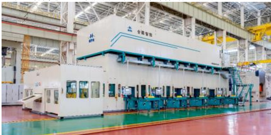
家电领域液压机快速冲压生产线

③智能家电领域：产品主要为高速伺服冲压液压机自动生产线，拉伸柔性好，技术水平达到国际先进水平，产品替代进口，主要应用于家电复杂零件的批量成形。