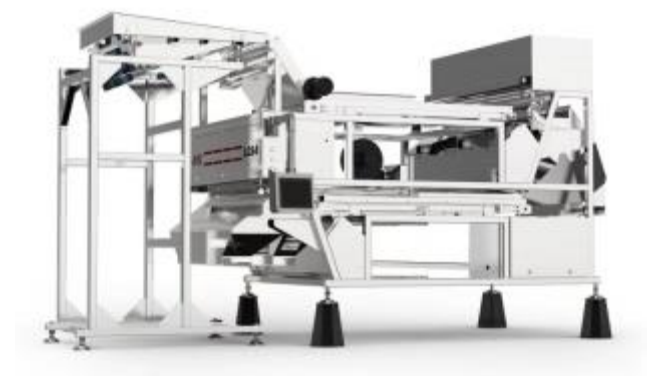
杂粮履带式色选机

杂粮涉及的行业多，分选物料品类多，涵盖的主要物料有玉米、花椒、花生、籽仁、碧根果、豆类、辣椒、中药材等。报告期内，公司基于深度学习的履带式及立式机型全面丰富，陆续推出了P-CY立式机、LTS履带机等全新升级机型，极大提升了产品性能及适用领域，尤其在玉米领域，在技术先进性和市场占有率上形成碾压式优势，引领众多杂粮细分领域分选技术变革。