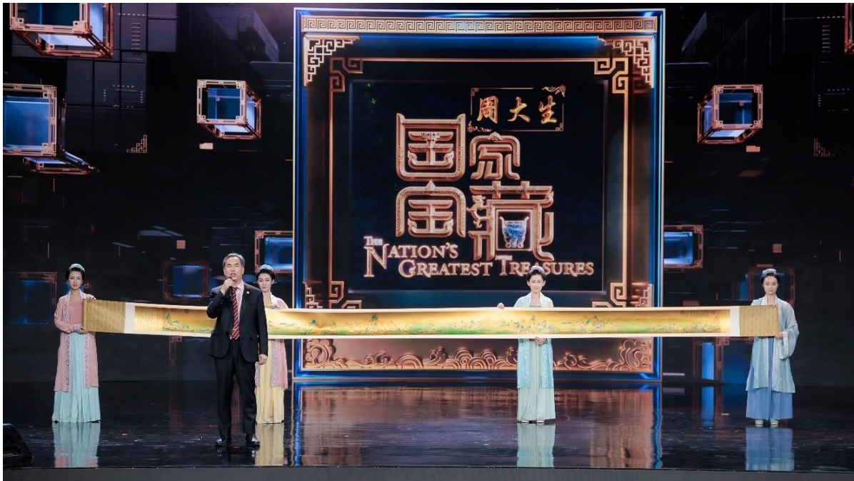
自 2022 年，公司官宣全新品牌代言人任嘉伦，开启全新品牌之旅。2024 年，公司子品牌“周大生经典”正式官宣