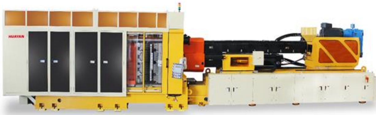
图 1: Epioneer 系列瓶坯智能成型系统

公司的瓶坯智能成型系统主要分为六个系列：高端 Epioneer 系列、中高端 EcoSys 系列、中端 HY-D 系列、小型 Econ 系列、油坯 HY-F 系列及瓶盖 HY-C 系列。此外，公司还针对个性化包装推出了可生产多色瓶坯的瓶坯成型系统。目前，公司自主研发的高端瓶坯智能成型系统 Epioneer 系列的最大产能可达到 90,000 坯/小时以上。