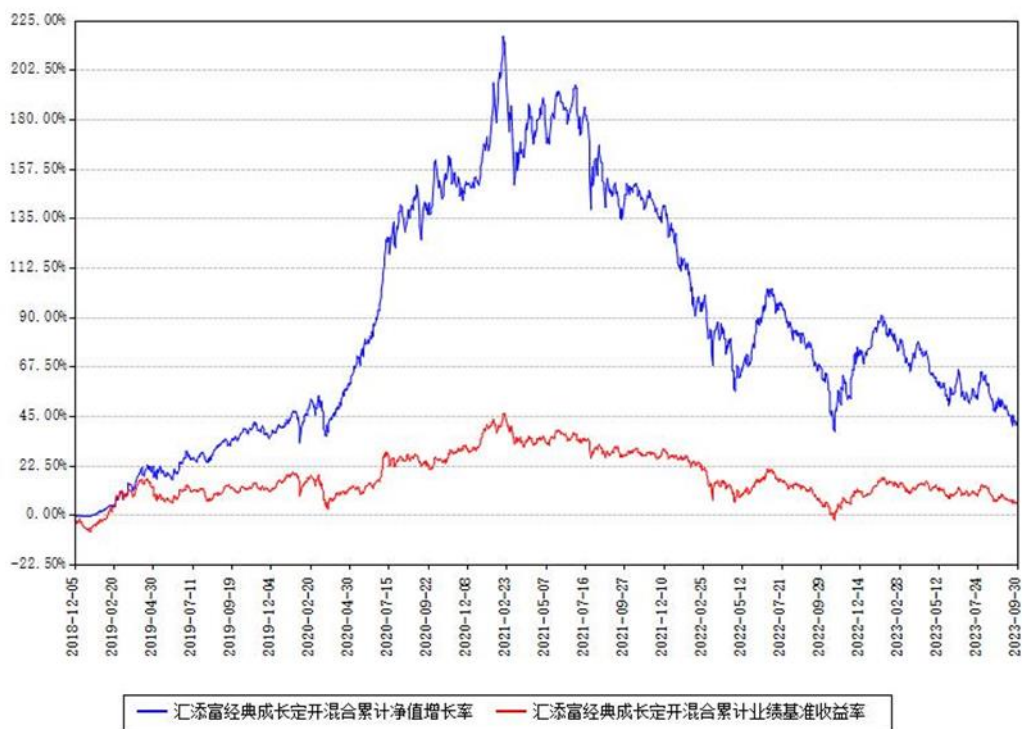
汇添富经典成长定开混合累计净值增长率与同期业绩基准收益率对比图