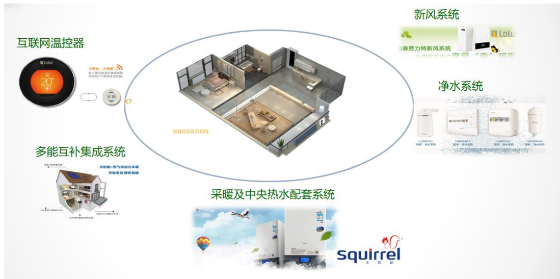
图4：舒适家居产业园业务布局：冷、暖、风、水、智