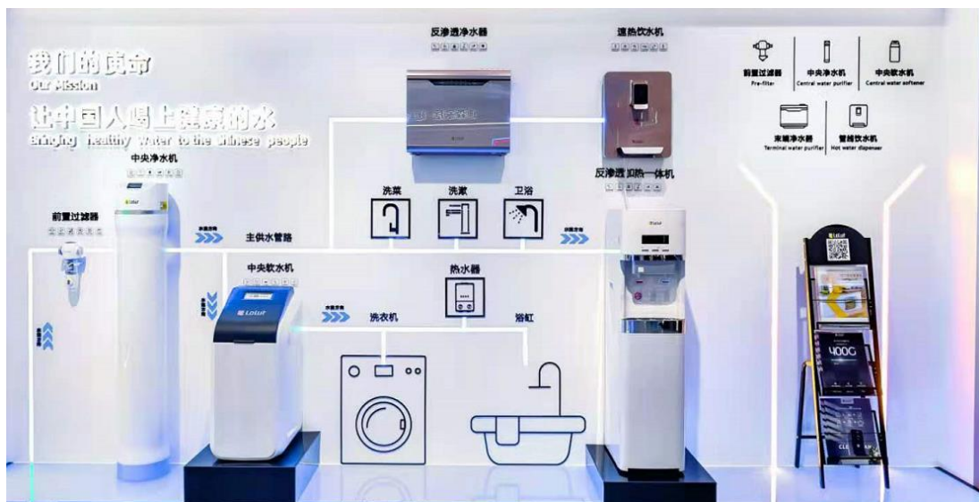
图7：“劳力特”净水系列产品

“劳力特”净水系列产品涵盖中央净水系统，解决入户端全屋用水净化问题；终端饮水系统，解决客厅等终端饮水问题；直饮水系统，解决厨房端直饮水处理问题；中央软水机系统，解决洗浴软水问题。公司净水系列产品可覆盖全屋前中后端用水需求，提供一体化健康用水方案，提升用户生活品质。