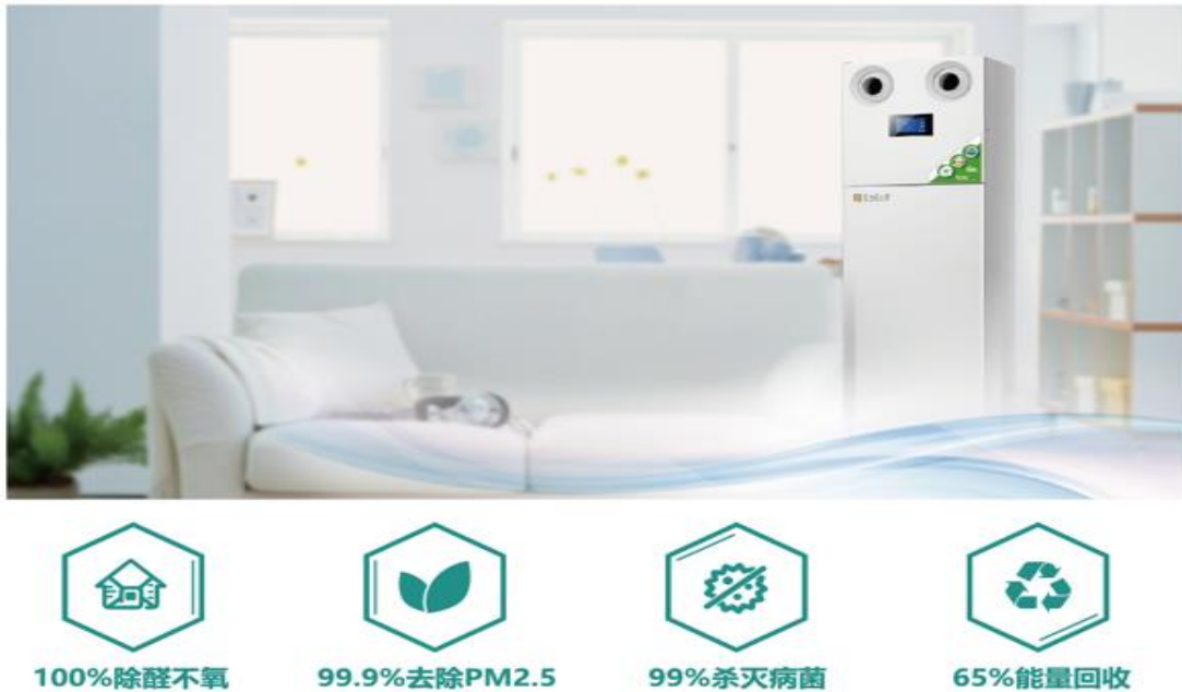
图6：劳力特新风系列产品

“劳力特”净水系列产品涵盖中央净水系统，解决入户端全屋用水净化问题；终端饮水系统，解决客厅等终端饮水问题；直饮水系统，解决厨房端直饮水处理问题；中央软水机系统，解决洗浴软水问题。公司净水系列产品可覆盖全屋前中后端用水需求，提供一体化健康用水方案，提升用户生活品质。