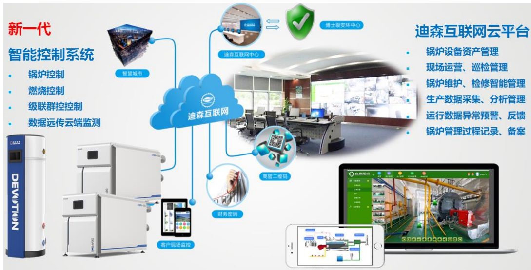
图3：物联网锅炉运营平台

报告期内，公司继续加大在节能高效、余热利用方面的积极探索，形成以减量化服务为目标的节能减排产业新业态、新模式。建设了功能先进的产品研发实验室，新开发的全预混商用热水锅炉、变频蒸汽机、容积式热水炉等商用系列产品，满足连锁酒店和小型商业体等商业用户需求，均采用了高效节能和超低烟气排放等先进技术，比传统燃气锅炉节能10-30%，占地面积小70%，随着国家城镇化建设的加快，这种商用产品的市场容量很大。余热锅炉、角管锅炉、撬装锅炉等新品的研发和量产，向“新”而行，工业锅炉→商用锅炉，传统锅炉→余热锅炉/角管锅炉，标志着迪森锅炉“新”时代的到来。目前，公司迪森（常锅）组建了专业的余热锅炉研发小组，产品已经应用于污泥发电、危废焚烧、沼气发电、天然气发电等项目的余热回收利用。与上海工业锅炉研究所合作开发的角管式燃气锅炉具有重量轻、热效率高、占地面积小、安全性好等显著优势，可以取代传统供暖和蒸汽锅炉，是大型燃气采暖锅炉的发展方向。公司将进一步加强细分领域的技术革新，提升产品与服务质量，提高品牌影响力。