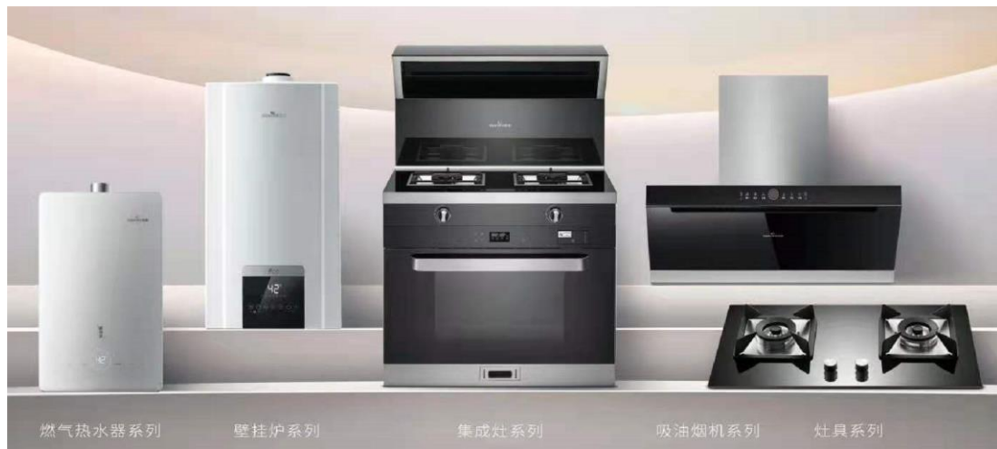
图5：“小松鼠”产品系列

“劳力特”新风系列产品可将室外空气净化除尘杀菌处理后送入室内，同时排出室内污浊空气，保持室内空气新鲜洁净健康，其搭载的定制冷热交换系统，可高效实现冷热能量回收，降低空气冷热量损失，同时还加强了多重过滤功能，可有效过滤PM2.5、静电集尘、花粉，可广泛应用于住宅、酒店、学校、医院等场所。