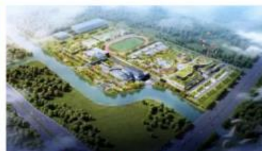
太仓市城东水质净化厂项目