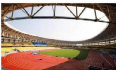
■ 武汉东西湖五环体育馆预制清水看台板项目