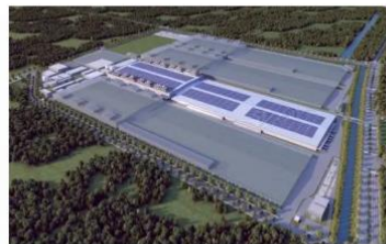
| 山东爱旭科技济南基地10GW高效晶硅太阳能电池组件项目