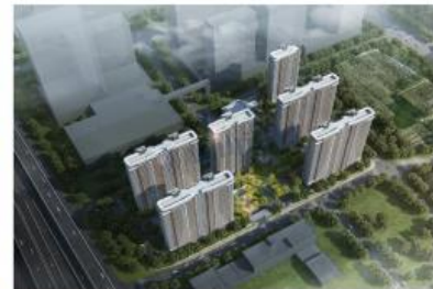
昆山高新区江浦路东侧、规划道路北侧地块商住用房新建项目（百乐门）