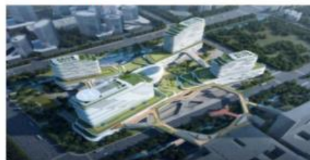
盐城市第一人民医院二期及医疗综合体