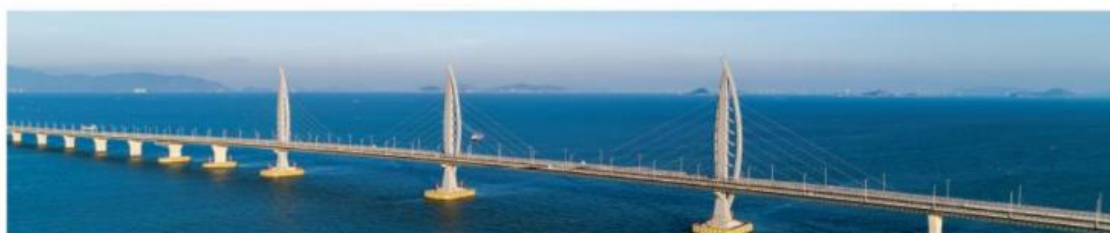
港珠澳大桥工程项目