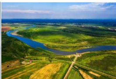
辽河流域(浑太水系)山水林田湖草沙一体化保护和修复工程(下游盘锦段)