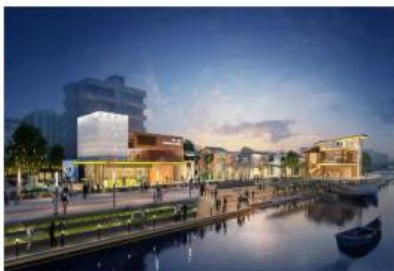
万顷沙镇渔舟唱晚新农村示范带（二期）设计施工总承包项目