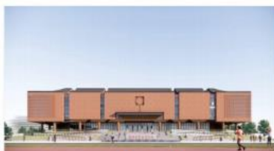
应县全民健身中心建设项目