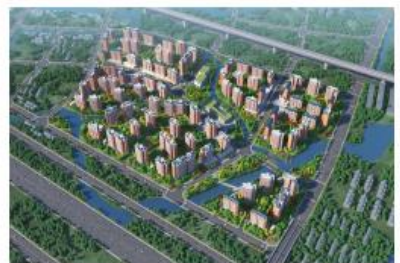
华为上海朱家角南侧人才公寓项目