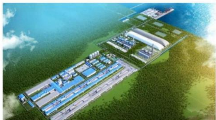
▲ 印尼北加电解铝项目