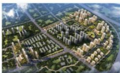
■ 武汉蔡甸中法生态城新天地还建设区装配式项目(PC)