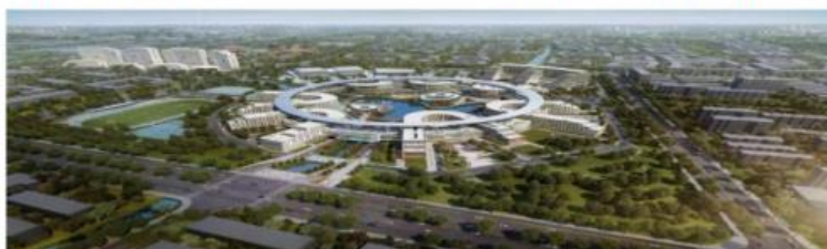
西郊利物浦大学太仓校区项目