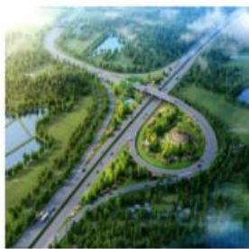
高青至武城高速公路商河至平原段高速公路