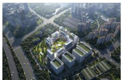
中国电信创新孵化(南方)基地三期项目