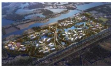
| 华为上海青浦研发生产项目