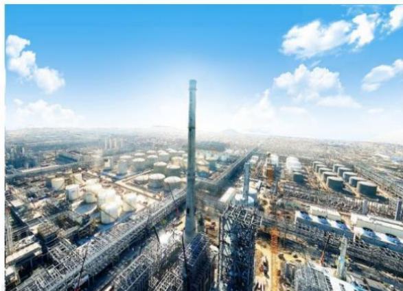
| 浙石化年产4000万吨炼化一体化项目