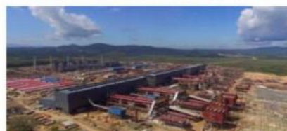
▲ 印尼苏拉威西岛莫罗瓦里县钢铁厂