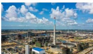
| 中科(广东)炼化一体化项目