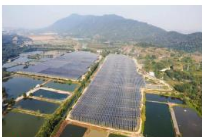
| 阿特斯四会220MW渔光互补项目