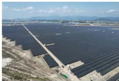
| 莺歌海盐场100MW平价光伏项目