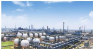
| 盛虹炼化一体化项目