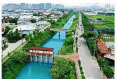
九龙江河口段水系综合整治（浮宫片）项目工程总承包