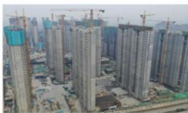
■ 招商东望府装配式项目(PC)