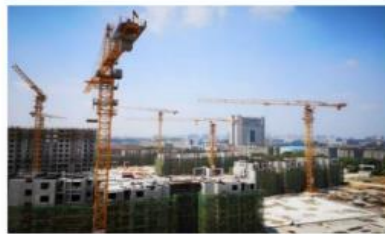
■ 南京熙园府装配式项目(PC)