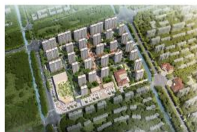
崇明区长兴镇G9CM-0401单元38-07地块桩基工程