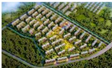
■ 南京中骏原璟园装配式项目(PC)