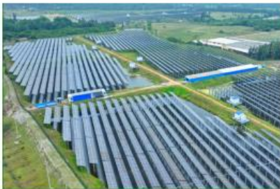
| 中广核文昌翁田 100MW 农渔光互补光伏发电项目