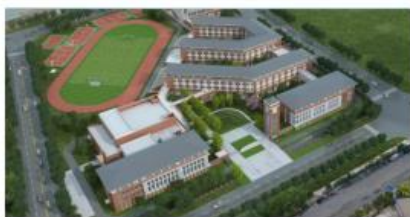
启秀中学滨江校区项目