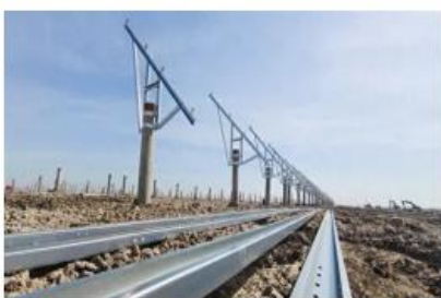
| 大庆油田大同区新能源建设光伏发电工程