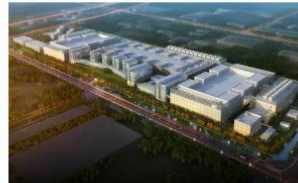
| 华虹半导体制造（无锡）有限公司华虹制造（无锡）项目