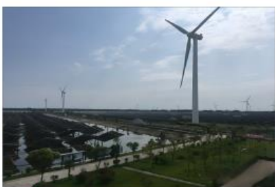
| 东台渔光互补项目