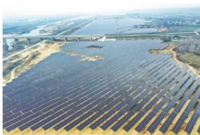
| 麻城市多能互补百万千瓦新能源基地项目