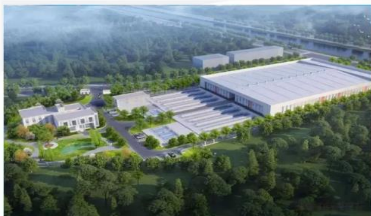
▲ 印尼南山氧化铝项目