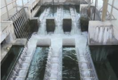
容桂水质净化厂项目