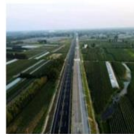
京沪高速改扩建sy4标