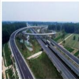
卓溧高速公路建湖至兴化段