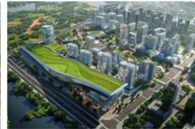
深圳前海·冰雪世界基坑支护及桩基础工程