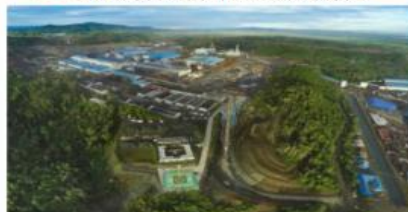
▲ 印尼青山镍业工业园