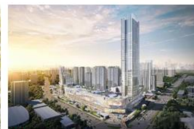
武汉龙湖新荣天街