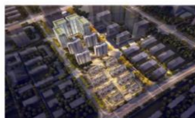
■ 武汉蔡甸中法之星一期装配式项目(PC)