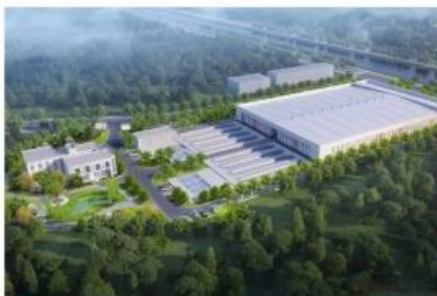
顺德区大良勒流水体综合整治工程-优先实施子项工程（一期）工程项目