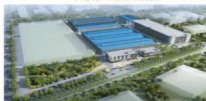
▲ 印尼三宝垄PVC管厂房建设开发项目