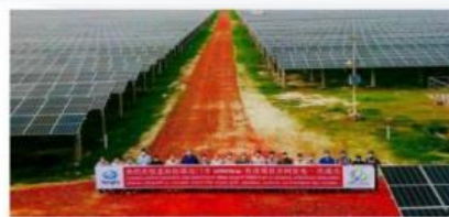
▲ 孟加拉国迈门辛市50MWac光伏项目