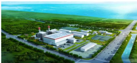
| 国投吉能（舟山）燃气发电有限公司2×745MW级燃气发电EPC总承包工程