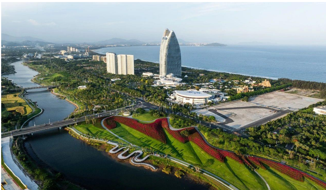
海棠河生态公园一期项目

普邦设计打造的三亚海棠河生态公园以建设生态优先、可持续发展的绿色河道为目标，修复河道生态系统和韧性体系，联通沿河与城市慢行系统，激活水岸并带动周边产业和经济的发展。最终打造生态的、人文的、活力的和未来的海棠城市风貌，成为三亚城市名片的全新载体。