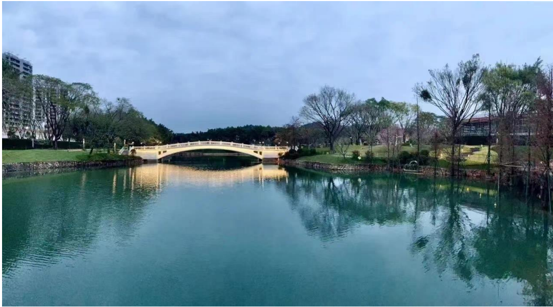
广州天河区世界大观一期月亮湖生态修复工程