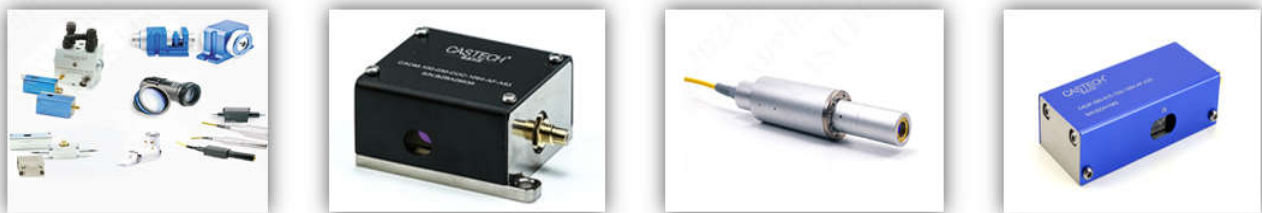
(部分激光器件产品图示)

公司生产的激光器件产品主要包括磁光器件、声光器件、电光器件、驱动器、光纤传输系统、光开关、光学镜头等。可用作光纤与固体激光器的声光调制器、电光调制器、Q开关、光隔离器等。主要应用于固体激光器、光纤激光器、激光设备、光纤传感等领域。