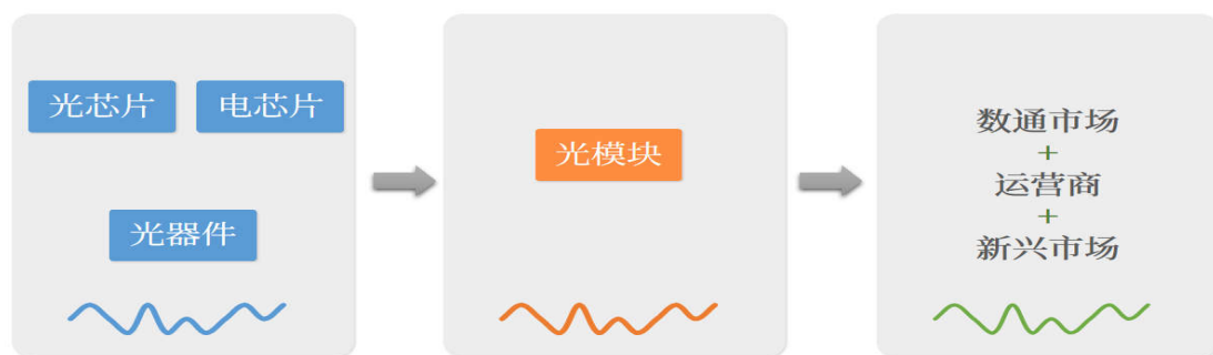
光模块产业链图示

在光通讯行业，LightCounting 预计全球光模块市场在历经 2023 年下降 6%后，2024 年全球光模块市场各细分市场的复苏具有不均衡性。DWDM 市场将出现温和复苏，而以太网光模块和 AOC 的销售预计将分别增长 40%和 25%，整个光模块市场未来 5 年将以 15%的复合增长率增长。