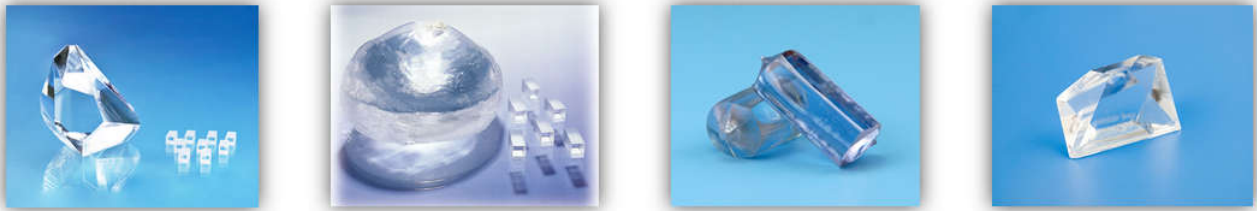
(部分晶体元器件产品图示)

作物质、非线性频率转换、磁光材料、电光材料等，作为激光器的关键元器件发挥产生激光、倍频转换、激光器运转等功能，主要应用于固体激光器、光纤激光器等激光器的制造。