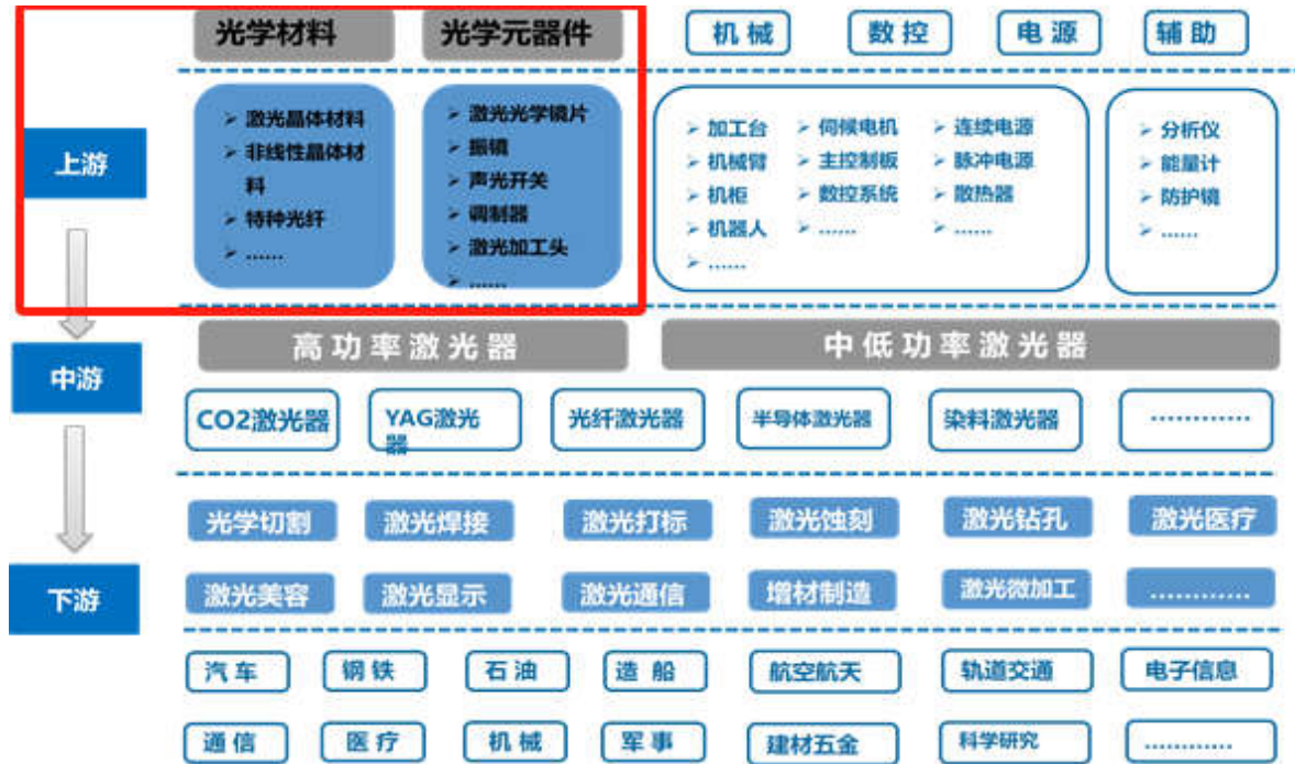
激光行业产业链示意图

激光钻孔、激光清洗、激光测量、激光熔覆、激光医疗、增材制造等设备，最终应用于工业制造、通讯、汽车生产、电子和半导体、医疗美容、新能源、航空航天以及科研等众多领域。