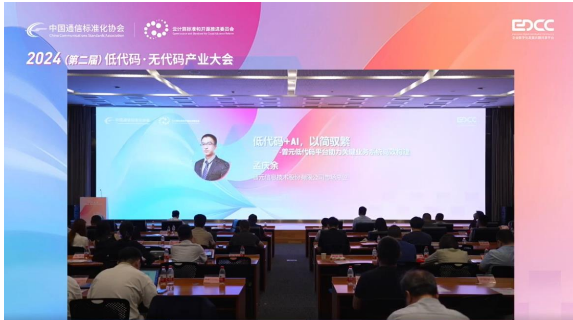
普元受邀参加 2024 低代码·无代码产业大会

工作办公室联合主办的 2024 世界品牌莫干山大会上，与 40 余家厂商共同发起成立信创品牌高质量发展联盟，推进中国信创品牌的建设与高质量成长。