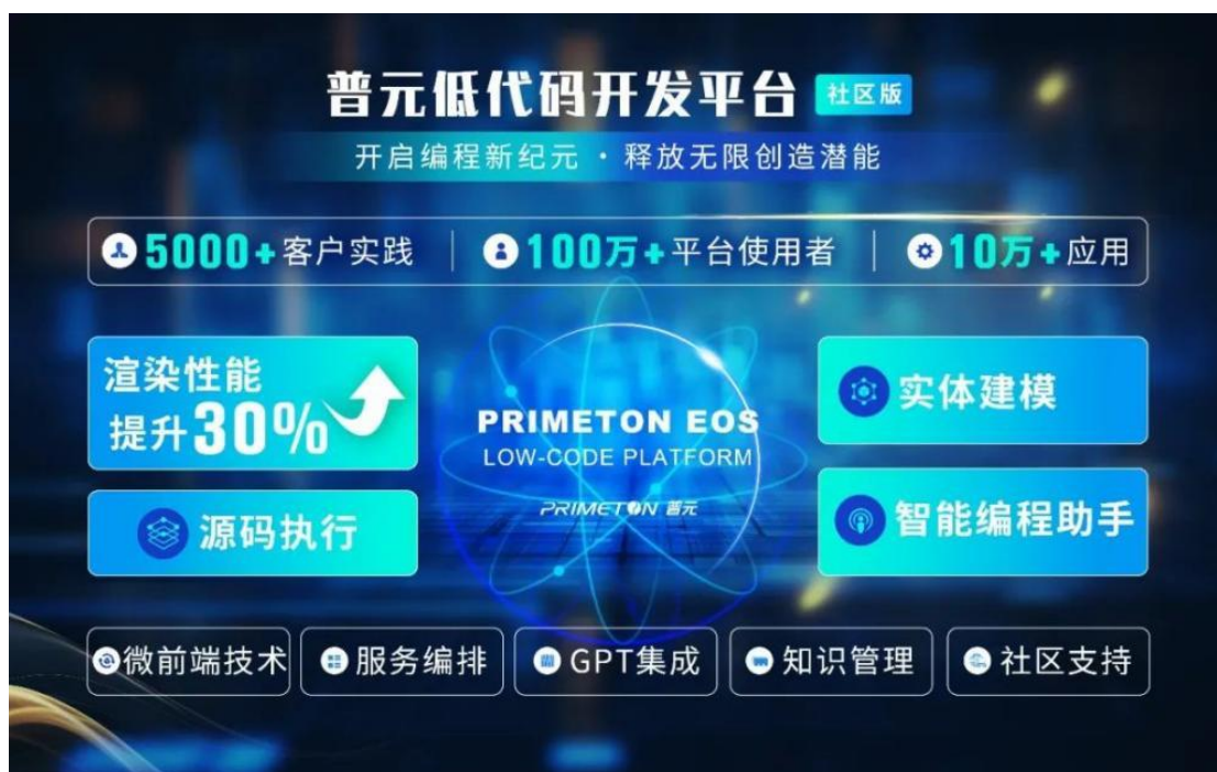
普元低代码开发平台社区版全新发布