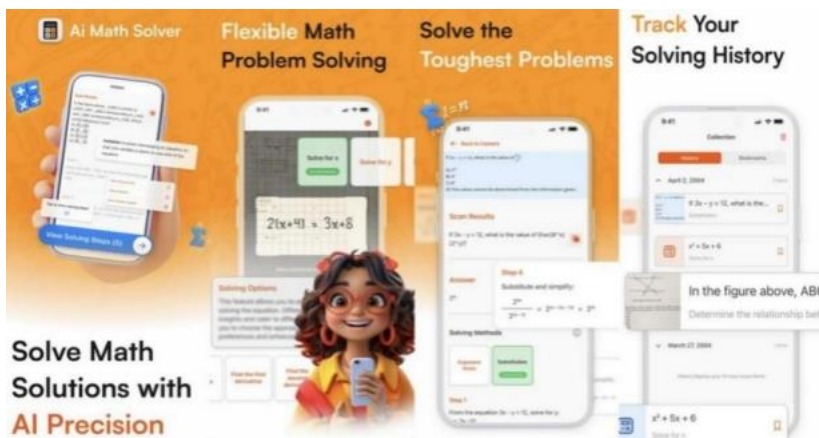
(AI Math Solver Now APP)

SPE、PM、EET 等公司已在现有部分业务中接入 ChatGPT，用于提升内容制作效率及质量，降低内容生成成本，丰富与用户的交互，从而提升用户的体验感和粘性。在移动端业务方面，ASKAI 等 App 已接入 ChatGPT，丰富了与用户的交互功能及输出的内容，提升了用户体验以及留存，更好地满足了用户使用需求；在 PC 端的数字媒体业务中使用 ChatGPT 为内容网站生成文章，包括生成高质量的文本、快速撰写商业文案、理解文本含义以及生成文字、图像和语音等多种形式的內容，在提升内容生产效率 and 用户留存方面初见成效；在自有浏览器 Wave Browser 的侧栏开发了快捷登陆功能，便于用户登录并使用 ChatGPT，以吸引用户留存；使用 AI 技术确定和执行策略以扩大覆盖范围，优化搜索。报告期内，PC 端业务上线了浏览器 Wave Pro，可为用户提供 AI 助理、广告拦截等付费订阅功能，其中，AI 助理功能集成 ChatGPT 模型，方便用户在浏览器侧边栏与 AI 助理交流，轻松进行多任务处理，提高工作效率。未来，互联网媒体业务将结合市场情况继续开发基于 AI 的产品，不断提升市场竞争力。