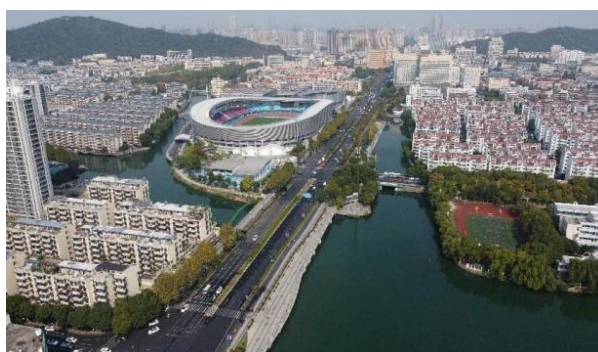
亚运场馆周边河道生态修复工程