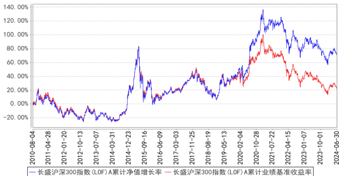
长盛沪深300指数(LOF)A累计净值增长率与同期业绩比较基准收益率的历史走势对比图