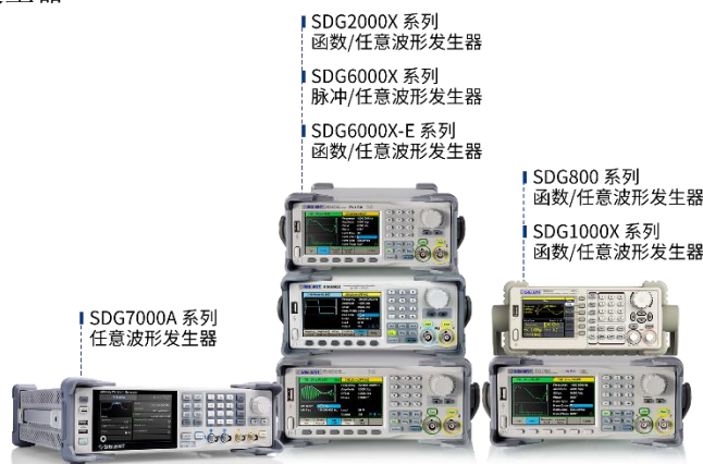
图 2：任意波形发生器产品