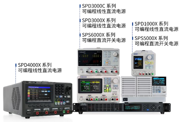
图 6：高精度可编程直流电源产品