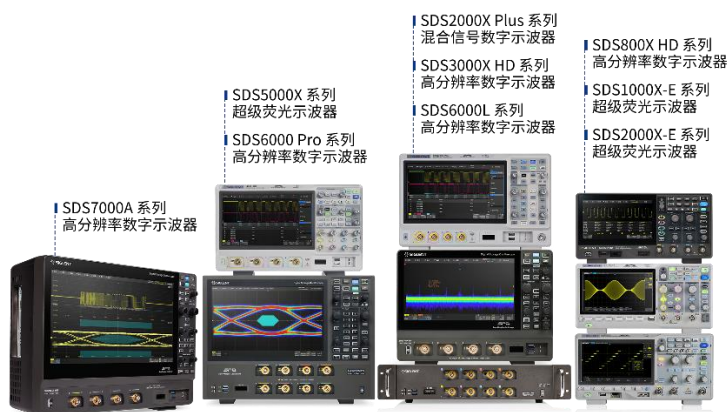
图 1：数字示波器产品