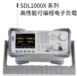
图 8：高性能可编程电子负载产品