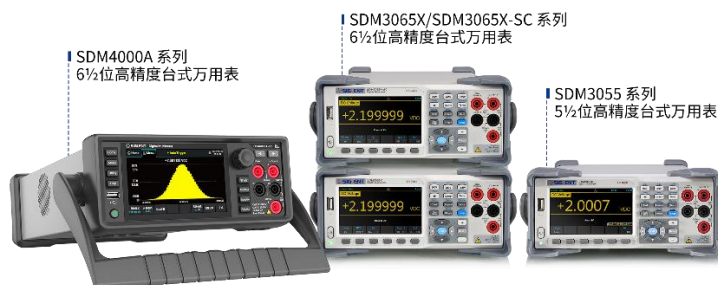
图 7：高精度台式万用表产品