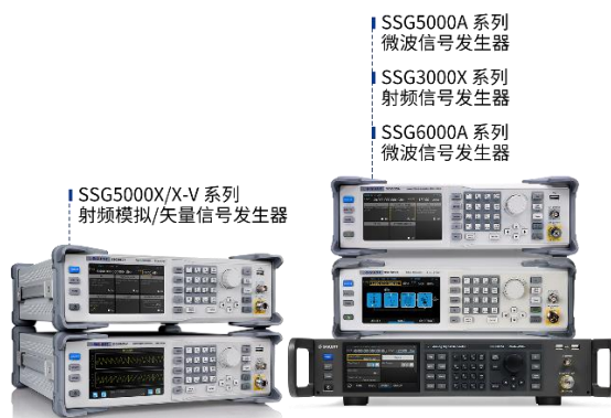
图 3：射频微波信号发生器产品