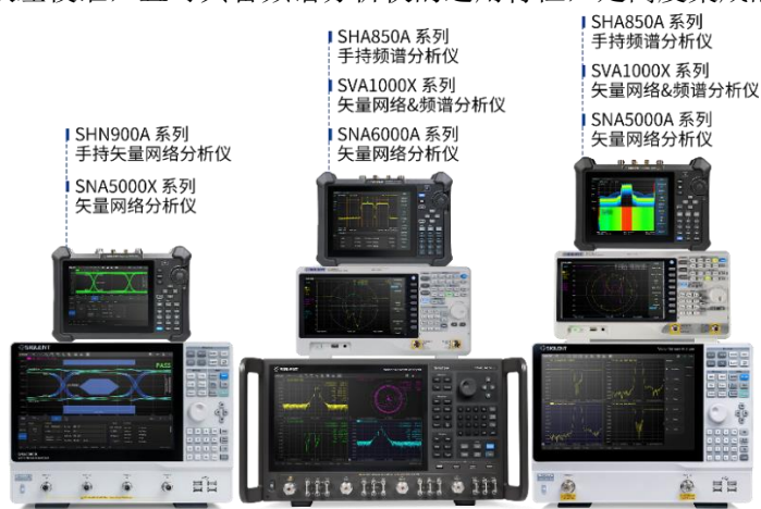
图 5：矢量网络分析仪产品

并且是诸多行业专用仪器的基础形态。公司矢量网络分析仪产品可实现多端口矢量 S 参数测量，实施各档次的系统误差校准，且可具备频谱分析仪的通用特性，是高度集成的射频微波仪器。