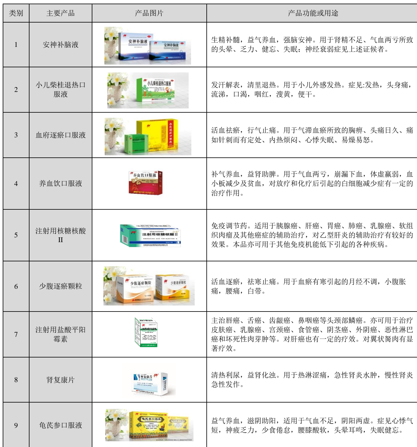
表 1. 主要产品目录

公司主要产品包括“安神补脑液”、“小儿柴桂退热口服液”、“血府逐瘀口服液”、“养血饮口服液”、“注射用核糖核酸Ⅱ”、“少腹逐瘀颗粒”、“注射用盐酸平阳霉素”、“肾复康片”、“龟芪参口服液”、“羚贝止咳糖浆”、“注射用丁二磺酸腺苷蛋氨酸”、“感冒清热胶囊”、“羧甲司坦泡腾片”等（详见表 1：主要产品目录）。