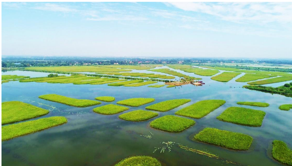
江苏省徐州市南四湖流域丰沛运河生态修复提升项目