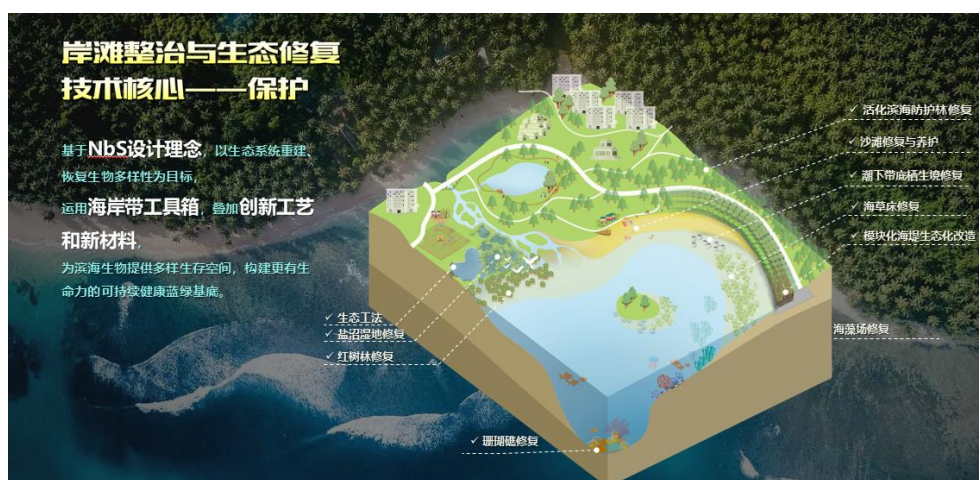
莆田·蓝色海湾综合整治项目

区别于传统海事和海洋保护业务,自主研发课题“典型海岸侵蚀防护与活力海岸构建关键技术”在厦门应用示范;珊瑚礁修复技术,在海南省东方市实施;预装配模块海堤生态化改造技术,在东莞滨海湾新区应用;红树林生态系统构建技术,在海南三亚山水项目应用。公司承接的海洋生态业务典型案例包括:莆田·蓝色海湾综合整治项目、广州南沙灵山岛尖外江生态提升 EPC 项目、东莞滨海湾新区硬质海堤生态提升项目。