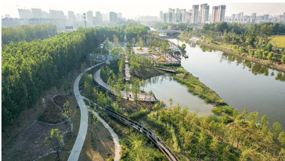
唐山东湖生态修复项目