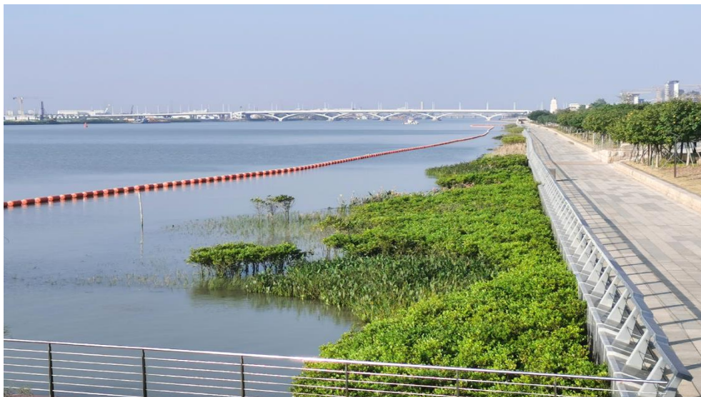
东莞滨海湾新区硬质海堤生态提升项目