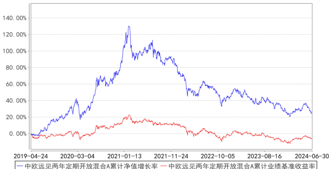
中欧远见两年定期开放混合A累计净值增长率与同期业绩比较基准收益率的历史走势对比图