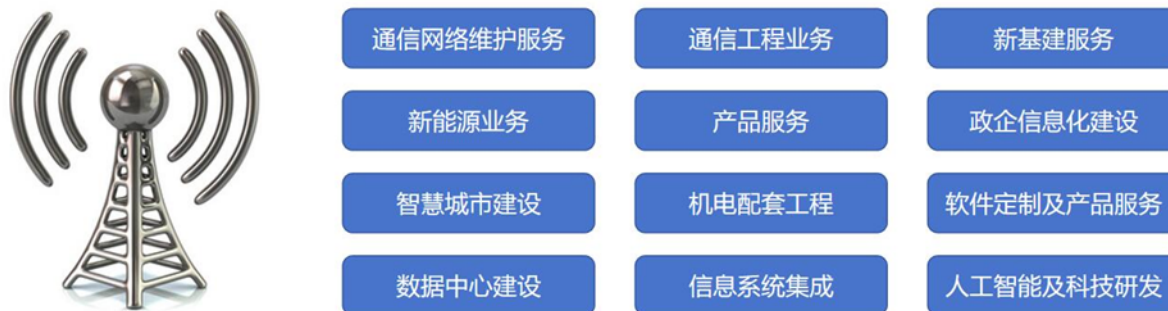
图表 长实通信业务介绍

2、通信网络维护业务主要是由长实通信对通信运营商及中国铁塔所拥有的网络资源实行运行管理、故障维修及日常维护等全方位的专业技术服务，保障网络正常运行，提高通信网络质量和运行效率。维护服务的内容包括基站、线路、宽带接入、固定电话接入、WLAN 的运行管理和维护保障。