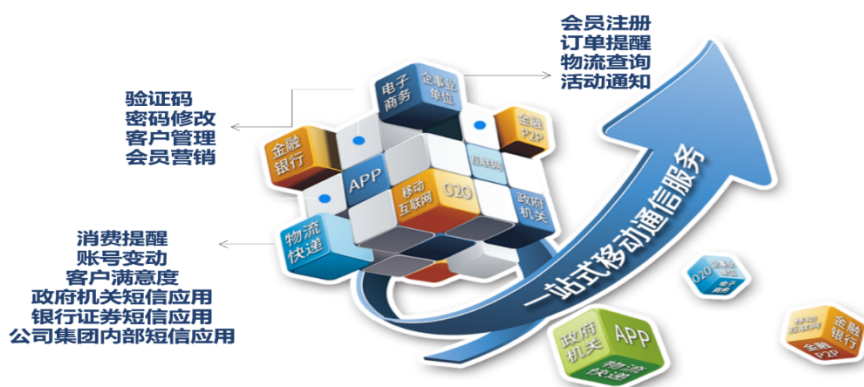
图表 信息智能传输业务应用场景

1、信息智能传输业务即创世漫道利用通信运营商移动通信网络系统及互联网，凭借自主研发的独立系统核心处理平台，向行业分布广泛、数量众多的企业公司、事业单位等客户提供的指定手机用户发送有真实需求的身份验证、提醒通知、信息确认、信息告知等触发类和真实需求的短信(含彩信,下同)，包括文字、图片或语音等格式载体，以及将指定手机用户向客户发送的短信息收集并回传的服务。同时为客户提供短信发送的各类接口产品及技术支持。