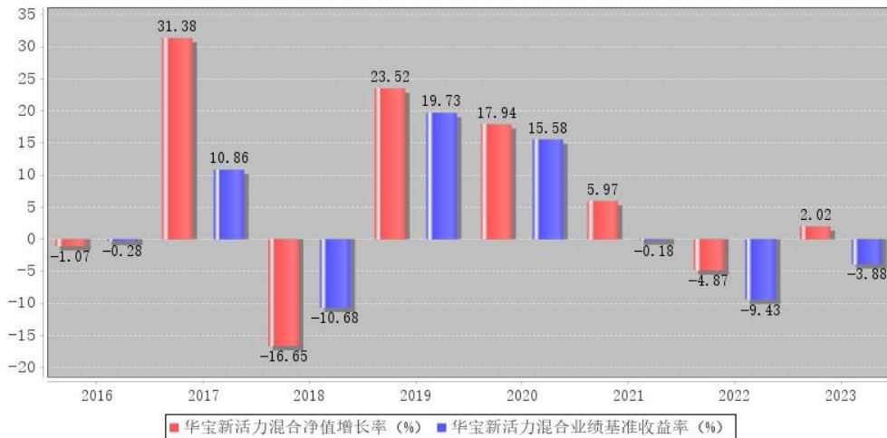
华宝新活力混合每年净值增长率与同期业绩比较基准收益率的对比图