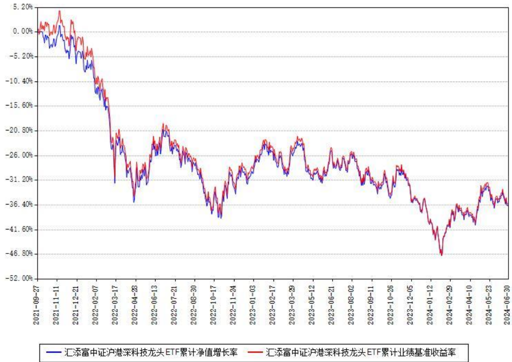
汇添富中证沪港深科技龙头ETF累计净值增长率与同期业绩基准收益率对比图