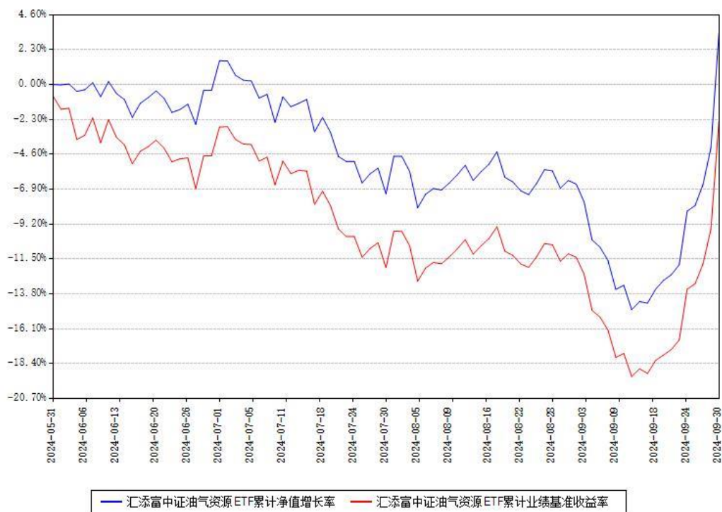
汇添富中证油气资源ETF累计净值增长率与同期业绩基准收益率对比图