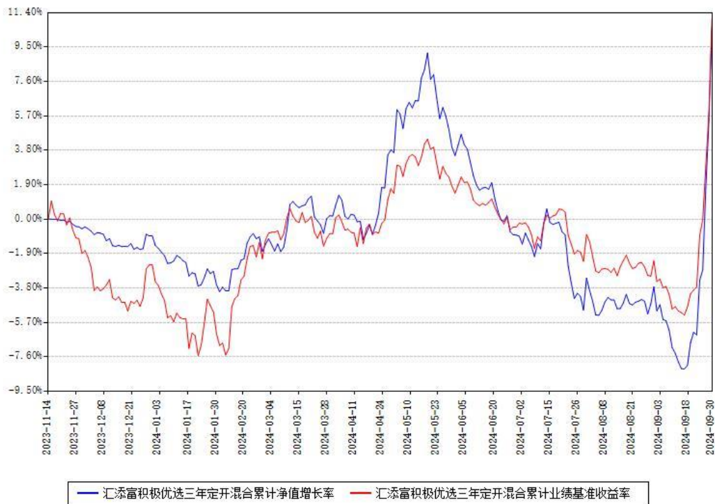
汇添富积极优选三年定开混合累计净值增长率与同期业绩基准收益率对比图