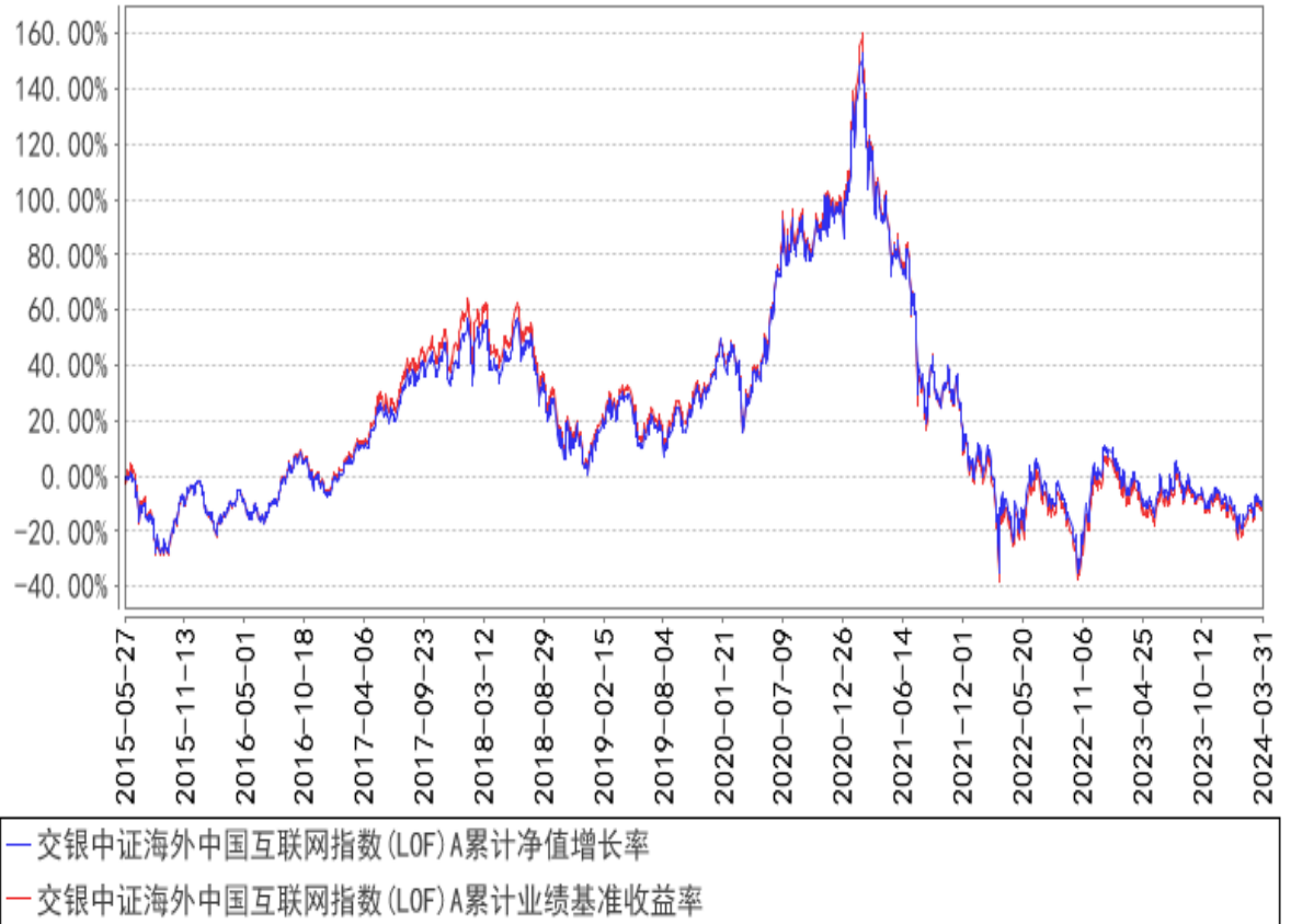
交银中证海外中国互联网指数(LOF)A累计净值增长率与同期业绩比较基准收益率的历史走势对比图