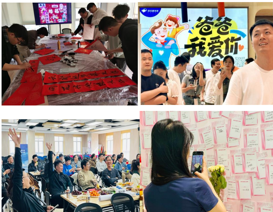
丰富多彩的员工活动

公司坚持以人为本，采取多种措施，努力保障职工的身心健康：公司总部基地一期投入使用，为员工提供良好的办公环境；组织全体员工参加健康体检，让员工及时了解自己的健康状况，并营造关心爱护员工健康的良好氛围；经常组织员工参加群体性、竞技性、娱乐性运动，如举办足球比赛、乒乓球比赛、室外拓展、参加马拉松比赛、团队接力长跑等，让大家在运动中强健体魄，健康、快乐地生活和工作。