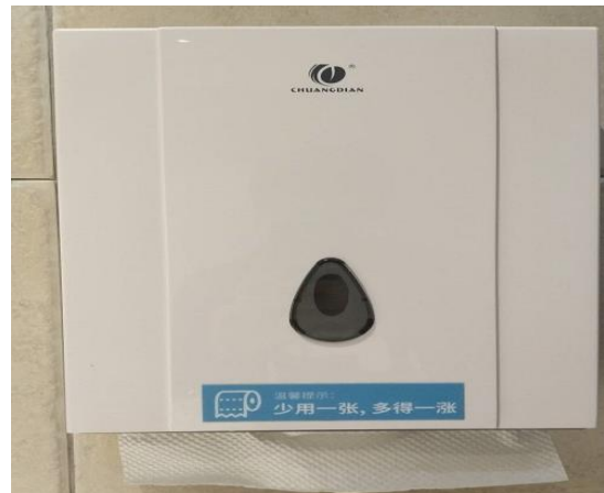
节约用水、用电、用纸宣传标识