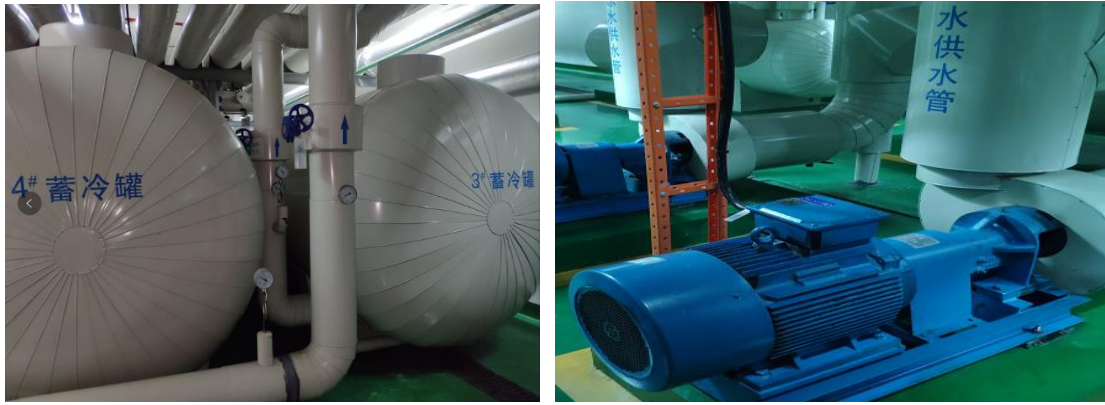
数据处理中心机房高效节能系统