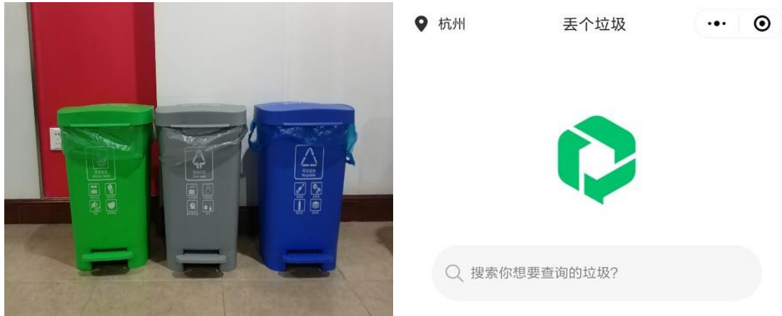
垃圾分类及“丢个垃圾”小程序