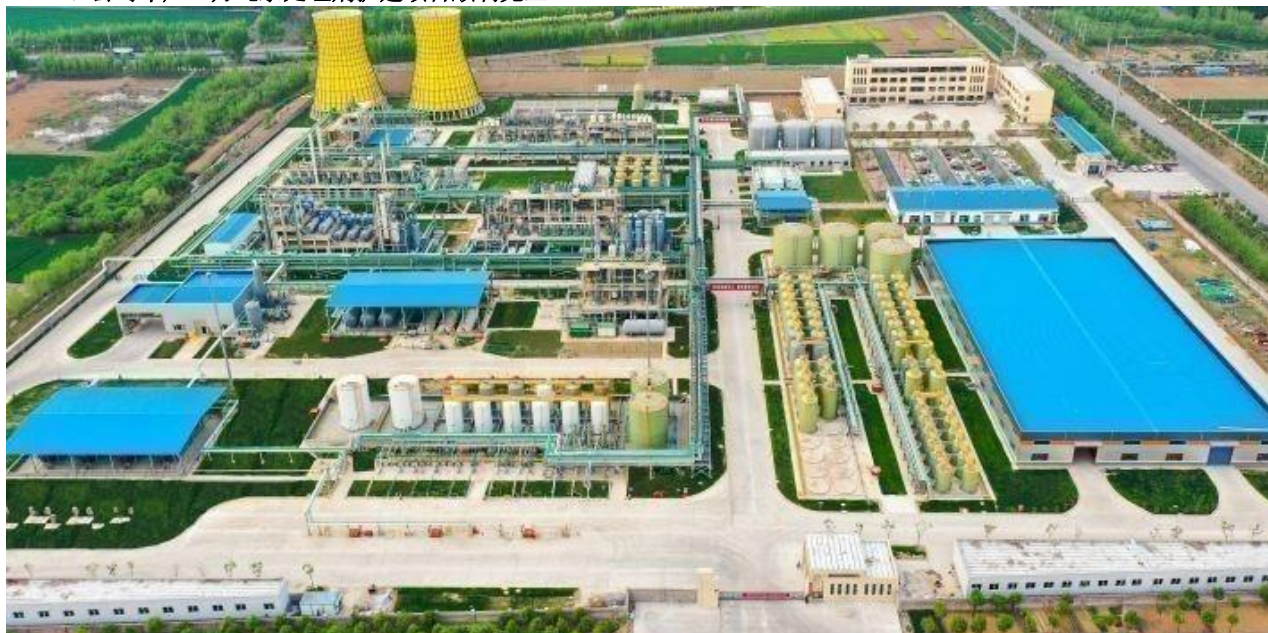
18万吨水处理剂扩建项目

报告期内，公司年产18万吨水处理剂扩建项目，按照原定计划高标准、高质量地完成了设备安装，截止目前已进入试生产阶段。该项目按照工业化、信息化融合要求，以自动化、智能化工厂建设为目标，实现生产管理、工业控制智能化、智能装备联动一键式生产模式，争创省级智能工厂。公司年产18万吨水处理剂扩建项目是巩固传统水处理剂产品竞争优势、不断开拓新型水处理剂市场的重要举措，达产后产品结构将得到进一步优化，产量也会得到大幅提升。该项目实施后将有利于巩固公司在水处理剂行业的领先地位，同时也有利于公司进一步开拓新型水处理剂市场，满足终端客户对复配产品的需求，助力公司高质量发展。