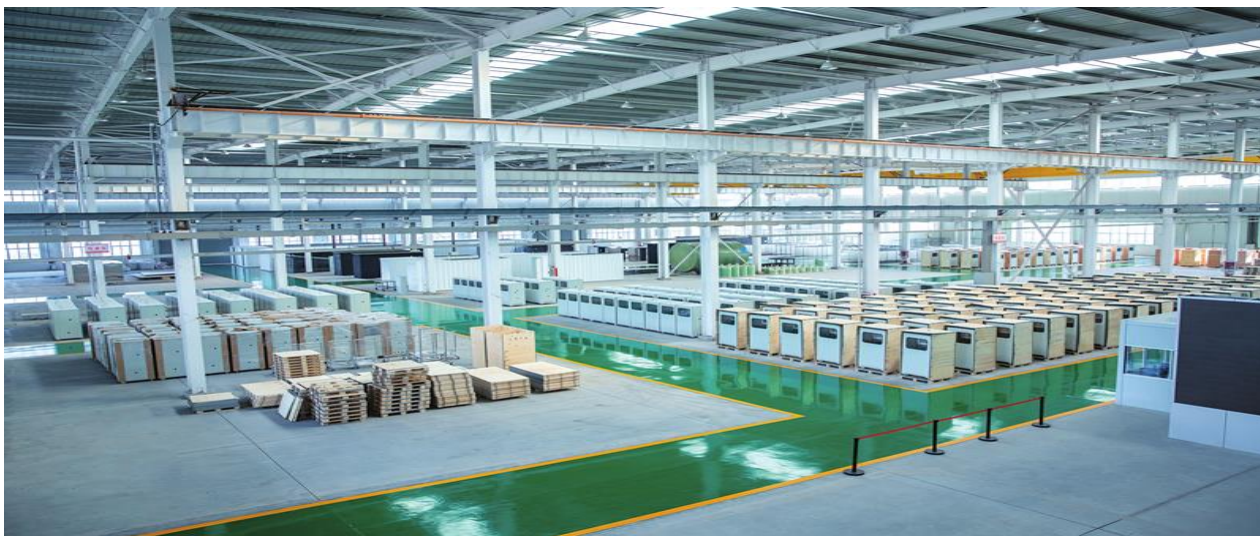
水云踪智能制造基地

河南水云踪智控科技有限公司经过探索与积累，打造出“水云踪”工业互联网平台系统，该系统实现了工业水处理系统运行的在线监测、智能加药、网络传输、异常报警和远程控制功能，能随时监控运行数据并实施智能化管理，将被动式事故处理变为早期预警和有效预防，为客户提供全过程智能化、定制化增值服务，是对传统水处理服务模式的一种创新。以此解决传统水处理业务存在的检测时间长、效率低、数据采集难、误差大、问题发现滞后、加药方式粗放、浪费严重等弊端。“水云踪”工业互联网平台先后被评为河南省服务型制造示范项目、河南省制造业“双创”平台，入选河南省省级重点培育的工业互联网平台培育名单、河南省制造业与互联网融合发展试点示范项目和国家级制造业“双创”平台试点示范项目。